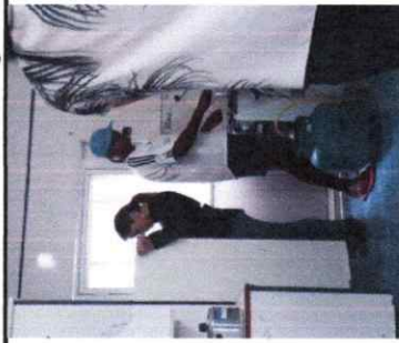
Organização da república