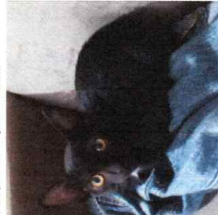
Mascote da República Feminina