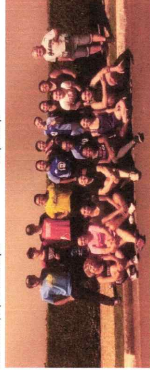
Treino de corrida com personal