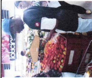
Compras no supermercado