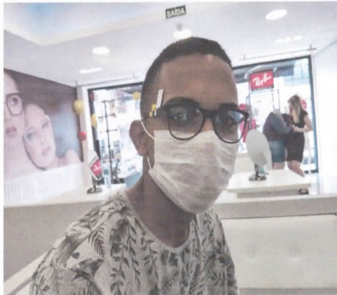
Doação de óculos