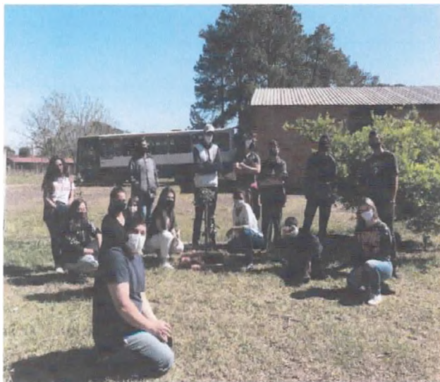
Plantio de árvores