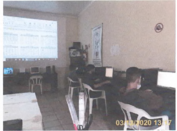
Programa de Inclusão Digital