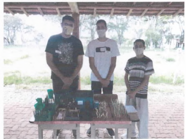
Apresentação de trabalho de conclusão