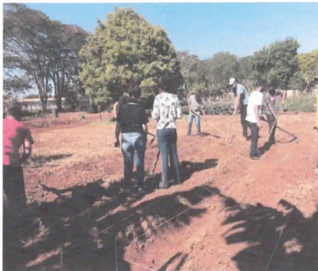
Preparo da terra