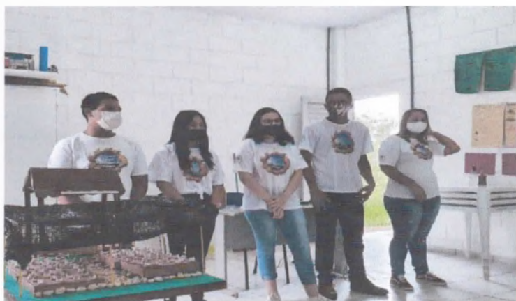
Apresentação do Trabalho de conclusão