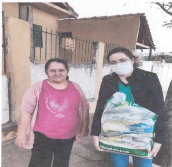
Entrega de cestas básicas