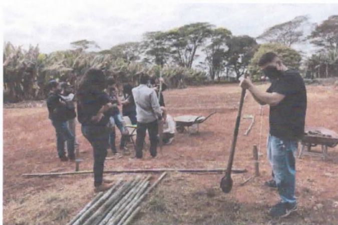
Preparação para plantio