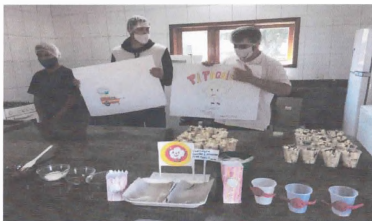
Atendimento ao cliente