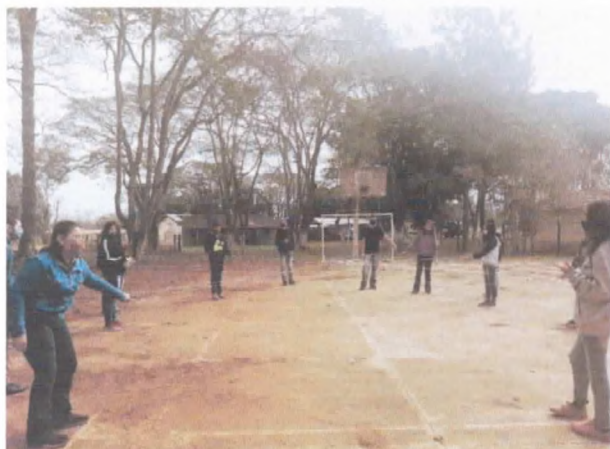
Dinâmica quebra gelo