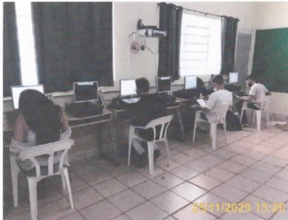
Programa de Inclusão Digital

Tel.: (015) 3271-8889 E-mail: proicasa@yahoo.com.br