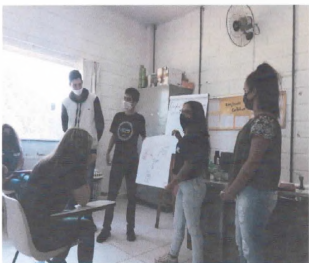
Apresentação de trabalho