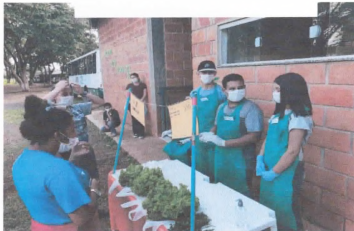
Atendimento ao cliente