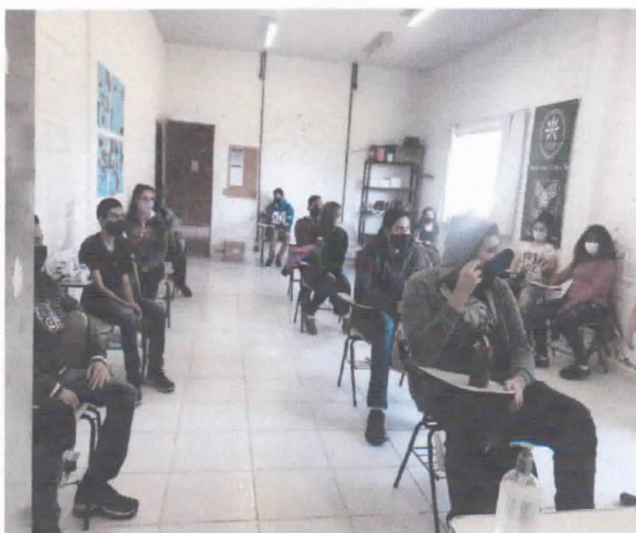
Atividade em sala