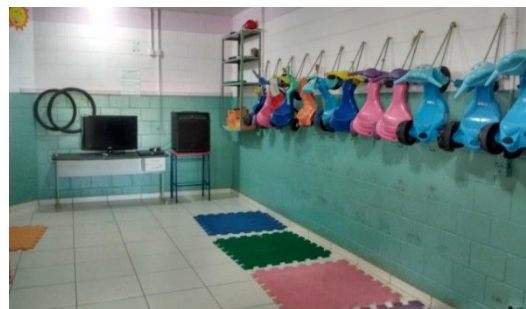
Sala de TV/Brinquedoteca