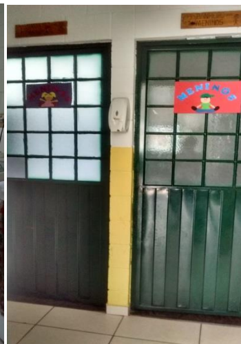
Banheiros das Crianças