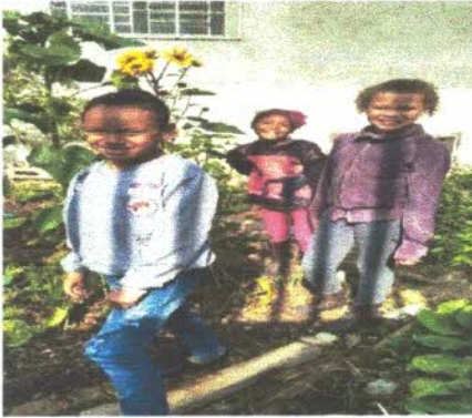
Oficina de informática