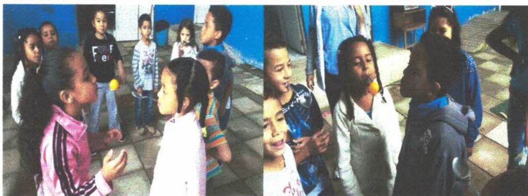
Brincadeira colher corrente onde as crianças em círculo devem passar a bolinha de uma colher para outra sem deixar cair.