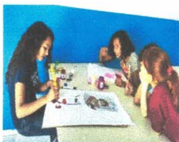
homenagem as crianças

Durante este mês de outubro realizamos a pintura do painel decorativos em comemoração aos 34 anos da Associação Caritas São Francisco, realizamos também a pintura em tecido em panos de prato e toalhinhas, onde também foi realizado pintura de bonecos palitos do murro da unidade, todas as atividades orientadas pelas educadoras e professora