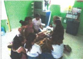
Oficina de informática

Durante o ano realizamos diversas aulas voltadas aos cultivos para uma horta e todos os cuidados possíveis, onde nestas ultimas semanas desenvolvemos aulas praticas e manejos, Após estas aulas realizamos uma deliciosa salada com algumas hortaliças de nossa horta.