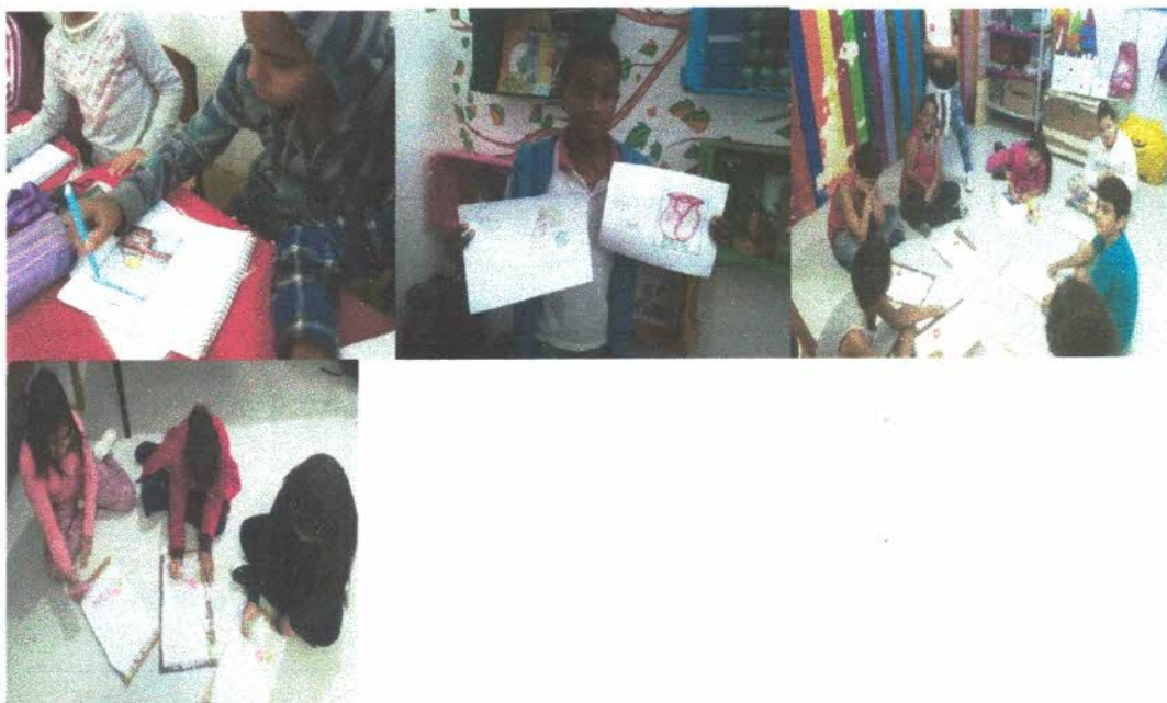
Oficina de Ed. Ambiental.