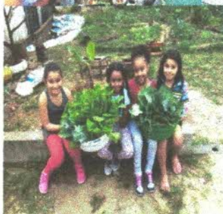
Oficina de Dança

A dança, enquanto um processo educacional, não se resume simplesmente na aquisição de habilidades, mas sim, poderá contribuir para o aprimoramento das habilidades básicas, dos padrões fundamentais do movimento, no desenvolvimento das potencialidades humanas e sua relação com os outros e ao mundo. O uso da dança como prática pedagógica favorece a criatividade, além de favorecer no processo de construção de conhecimento.