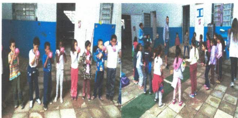
Brincadeira estoura bexiga com a bouca