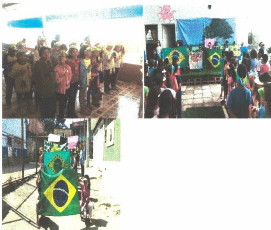
Semana do trânsito com a presença da guarda municipal de Jandira.