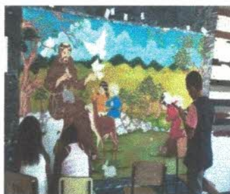
Festa Aula tema Chaves em

Festa aconteceu no dia 11 de outubro com direito a baile a fantasia, muitos doces brincadeiras musicas, bolo, sorvete, refrigerantes e muita diversão