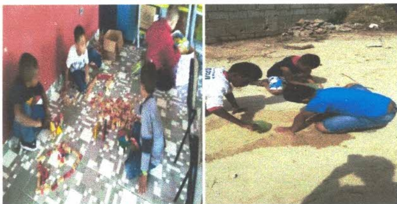
Oficina de leitura e cidadania,

Este projeto foi desenvolvido, possibilitando um trabalho interdisciplinar. De forma prazerosa onde iniciamos com a contação de História das datas comemorativas do mês Natal, nascimento de Cristo onde realizamos diversas leituras bíblicas e poemas que falavam sobre a, a sua importância, desta data para toda a humanidade realizamos esse momento de fraternidade onde filmes que falam sobre a chegada do menino Jesus, também cantamos algumas músicas natalinas infantis como bata sino de Belém, noite bela, nasceu salvador e também música Meu coração entre outras músicas natalinas que as próprias crianças compartilharam com a educadora