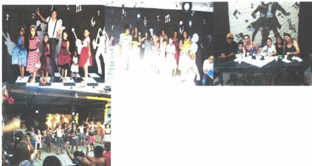
Festa aula em homenagem aos aniversariantes do mês