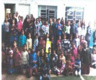
Oficina de artesanato

Nesta oficina trabalhamos crochê que também é considerado artesanato folclórico onde algumas peças de enxovias são confeccionadas pelas próprias mãos incentivando a criatividade de cada um, e também iniciamos com as aulas em ponto cruz. Nas aulas de ponto cruz a criança recebe, um retalho de ponto cruz, agulha e linha onde cada criança é ensinada passo a passo no desenvolvimento da atividade em alguns momentos pega-se nas mãos das crianças para realização da atividade proposta.