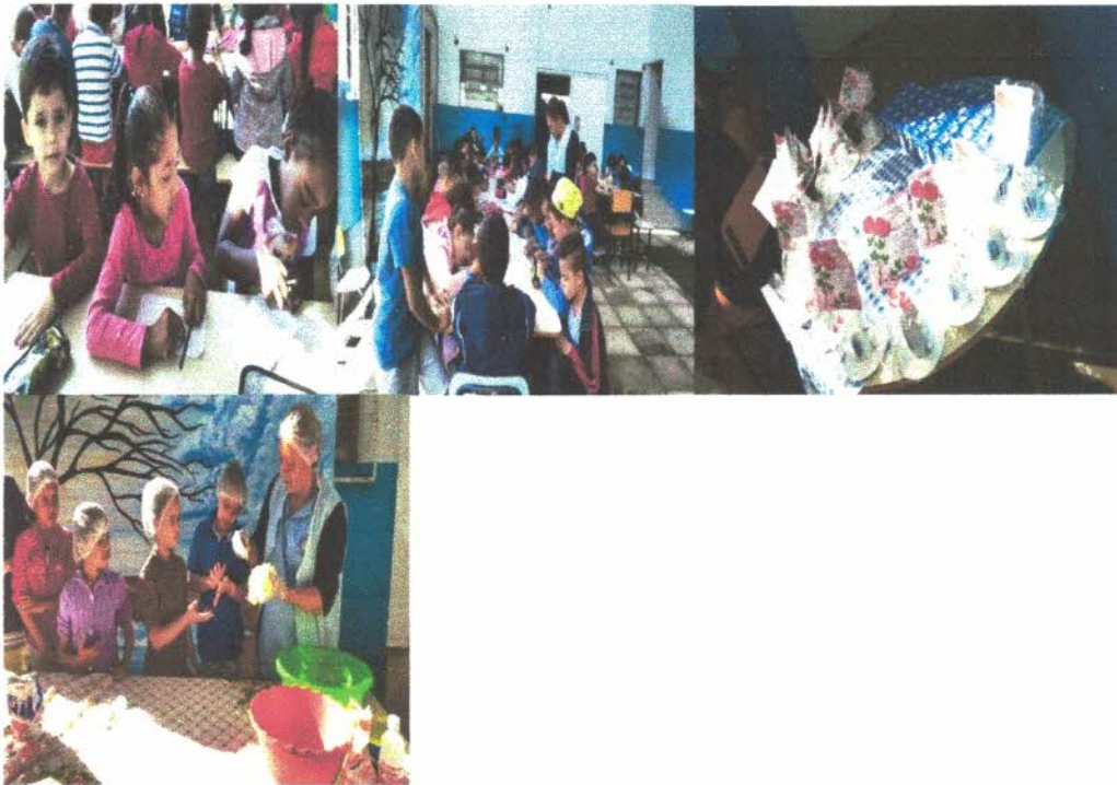
Desenvolvendo cartas e cartões, docinhos e lembrancinhas para as avós.