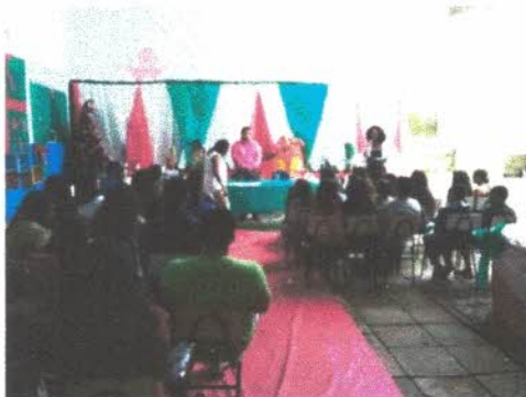
Projeto Cine B

. Para o processo de melhora da digitação e concentração durante a digitação de diversos temas desenvolvidos nas aulas de informática, nestes últimos dias as aulas foram bem dinâmicas onde cada criança pode escolher entre digitar ou acessar alguns jogos propostos durante as aulas de informática deixando as crianças bem tranquilas nas aulas. Onde para concluir nosso trabalho de informática com as crianças realizamos uma pequena cerimônia para encerrar as atividades com a presença da direção e famílias.