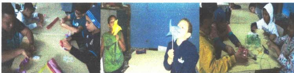
Oficina de leitura e cidadania,

Este projeto foi desenvolvido, possibilitando um trabalho interdisciplinar. De forma prazerosa onde utilizamos, a contação de histórias folclóricas, confecção de cartazes sobre culinárias, brincadeiras folclóricas, parlendas, trava língua, teatros sobre o tema Folclore. Dentro desta oficina também os incentivamos a leitura e a escrita auxiliando nos trabalhos escolares. Durante a semana do dia dos pais realizamos varal de poemas onde cada criança pode expressar os sentimentos aos pais, cartinhas, desenhos onde todas essas atividades foram encaminhadas às famílias.