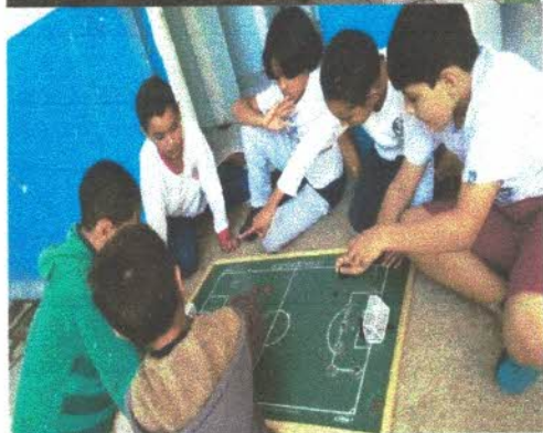
Brincadeiras de ping pong, brincadeiras jogo da vareta resta um e futebol de botão