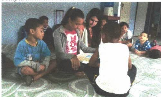
Oficina de Artesanato

Este projeto foi desenvolvido, possibilitando um trabalho interdisciplinar. De forma prazerosa onde iniciamos com a contação de História das datas comemorativas do mês Natal, nascimento de Cristo onde realizamos diversas leituras bíblicas e poemas que falavam sobre a, a sua importância, desta data para toda a humanidade realizamos esse momento de fraternidade onde filmes que falam sobre a chegada do menino Jesus, também cantamos algumas músicas natalinas infantis como bata sino de Belém, noite bela, nasceu salvador e também música Meu coração entre outras músicas natalinas que as próprias crianças compartilharam com a educadora