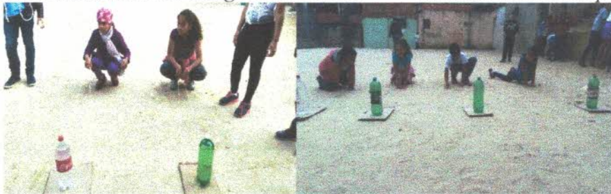
Brincadeira, corrida da garrafa pet com papelão, a garrafa deve estar cheia de água em cima de um papelão amarrado com barbante a criança deve puxar até a area ganhando quem chega primeiro.