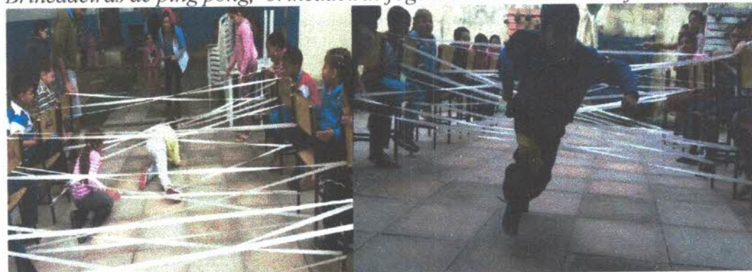
Brincadeira cama de gato onde as crianças devem passar pelos embaraços dos elasticos sem encostar ganhando quem consegue chegar primeiro