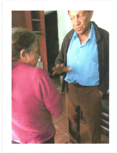
Foto tirada no reencontro, já em Sorocaba.