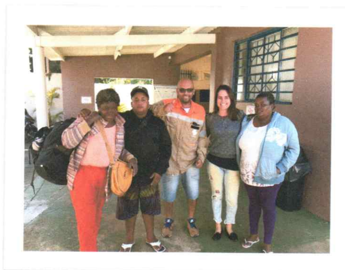
Foto do reencontro familiar