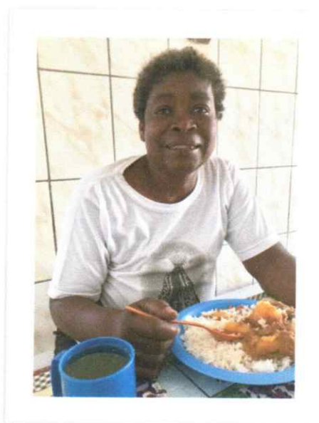
Foto da usuária almoçando no S.O.S.