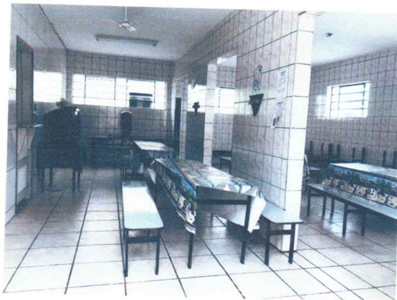
Refeitório e refeições

Rua Pedro Voss, n. 490 * Vila Aparecida * fone: (15) * 3273-1304 * Itapetininga - SP