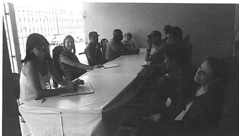
Reunião semanal com moradores