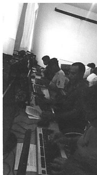
Curso de informática