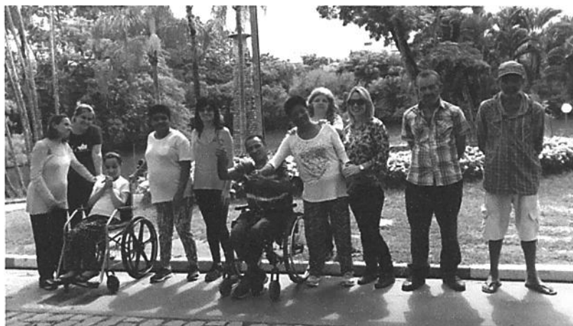
Passeio ao parque Edmundo Zanoni