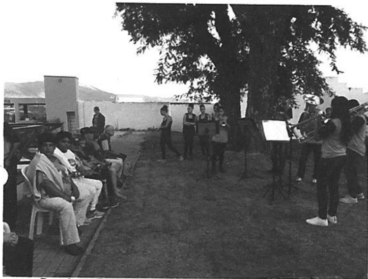
Passado ao Centro Cultural