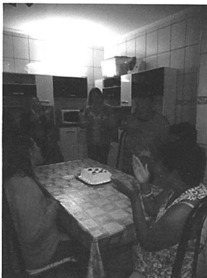
Aniversariantes do mês