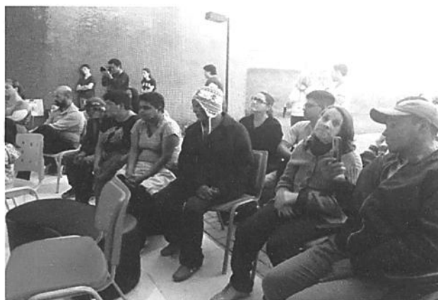
Passeio Estação Sesi de Cultura