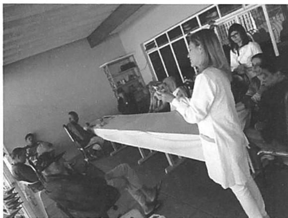
Palestra com Dentista