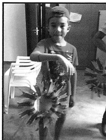
Ludicidade - CRAS Tanque – dezembro/2018