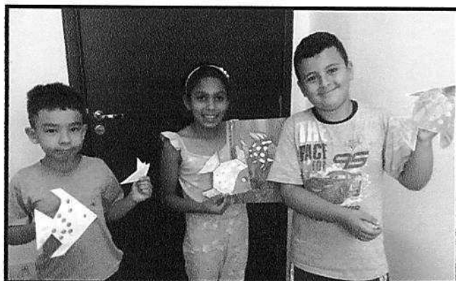
Ludicidade - CRAS Tanque – setembro/2018

Objetivo da oficina: desenvolver a atenção, concentração e memorização durante os jogos e brincadeiras, auxiliando no amadurecimento cognitivo e integral da criança. Promover a socialização, despertar a imaginação, criatividade, oralidade e o raciocínio, enfim, todos os aspectos básicos para o processo de aprendizagem.