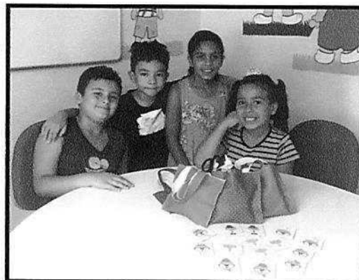
Ludicidade – CRAS Tanque – outubro/2018