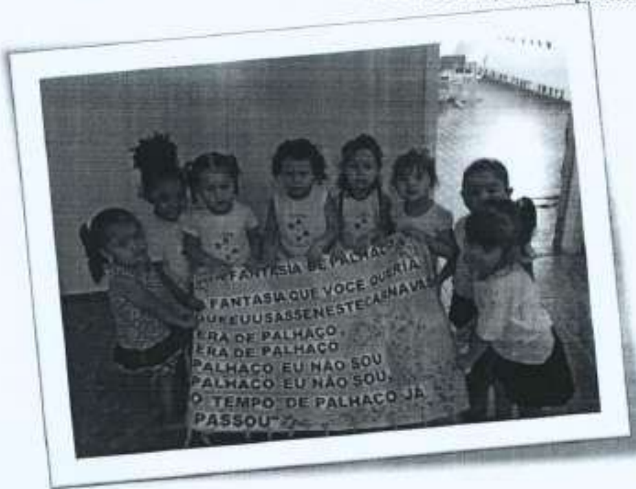
Lembrancinha do Carnaval de 2017 – Fantoche de Palhaço

Foi feito um cartaz com a música e afixar na sala de aula, cantar apontando à escrita.