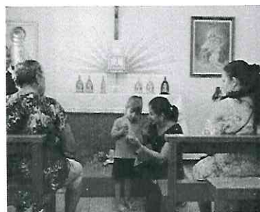
Entrega da Imagem da Mãe Peregrina