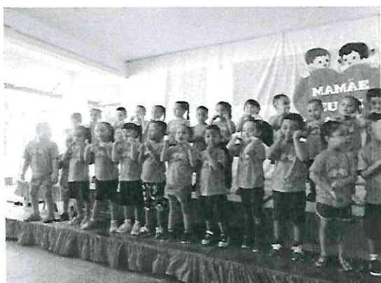
Homenagem Dia das Mães