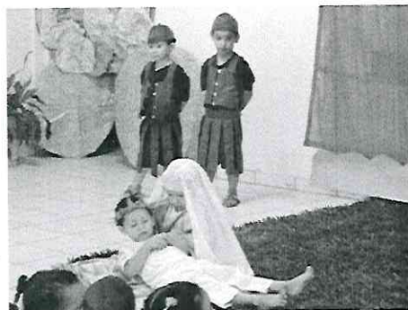
Teatro da Paixão de Cristo