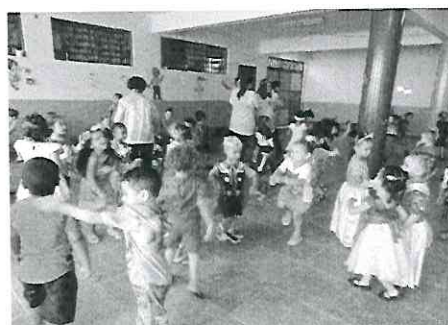
Baile de carnaval