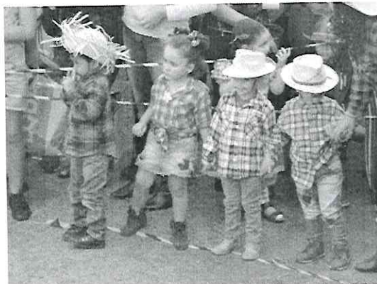
Festa Junina – Arraiá Raio de Sol