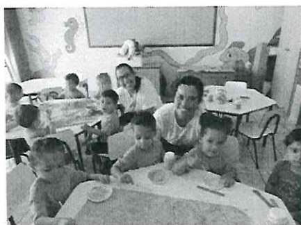
Atividade com pintura