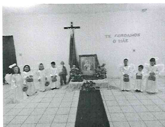
Coroação de Nossa Senhora