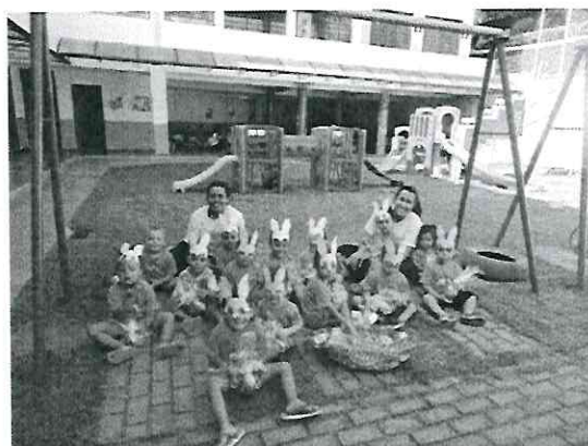
Caçada aos Ovos de Páscoa