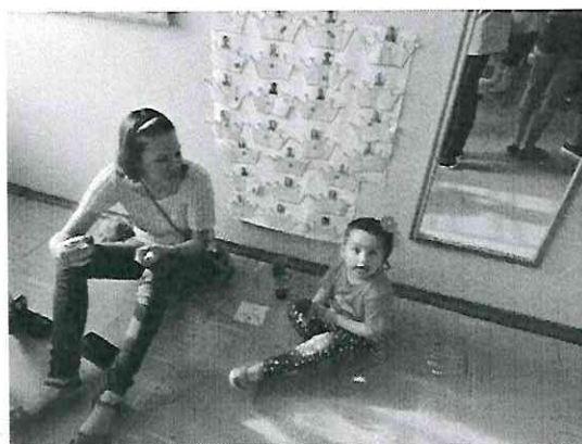
Café da tarde com a mamãe