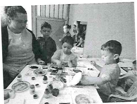
Preparando o presente para o papai

Os aniversariantes do mês foram lembrados com uma linda festa no dia 31. O EU O OUTRO E O NÓS (EI02EO03).