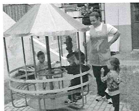
Primeiro dia de aula