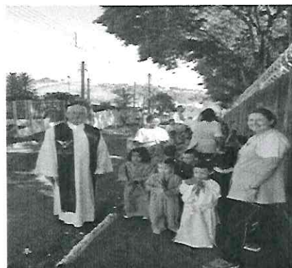
Teatro e Procissão de Ramos