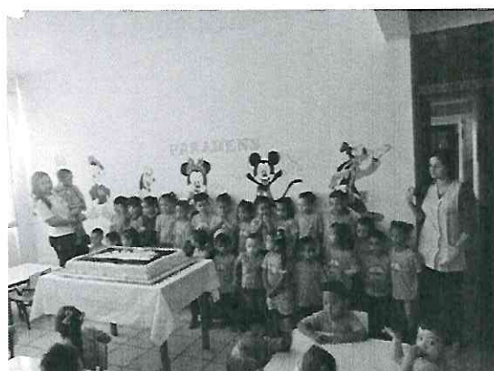
Comemoração Aniversariantes do mês