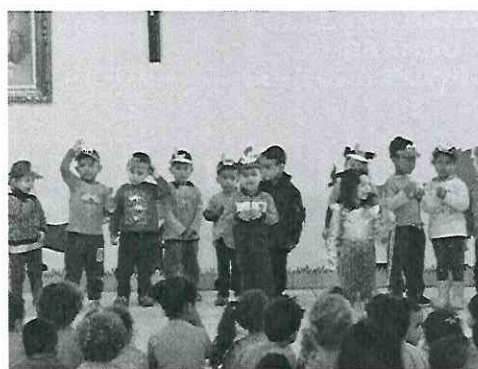
Dia do Folclore