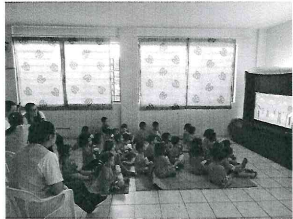
Sessão de Cinema