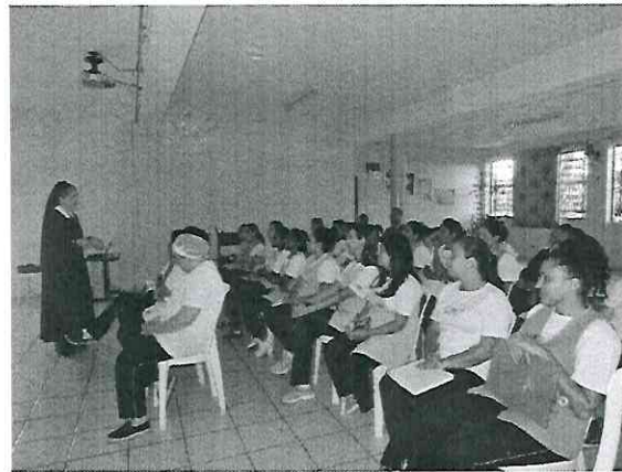
“Planejamento Financeiro Familiar”