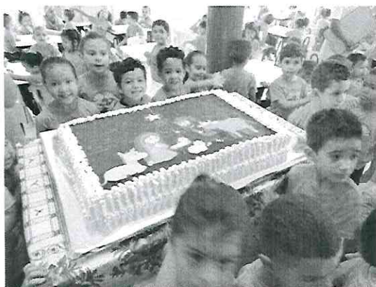
Aniversário do Menino Jesus

Nos dias 16, 17, e 18 as crianças tiveram recreação, com jogos e brincadeiras, e foi realizado a inauguração da nossa brinquedoteca. O EU, O OUTRO E O NÓS (EI02EO07) CORPO, GESTOS E MOVIMENTOS (EI02CG01, EI02CG03) TRAÇOS, SONS, CORES E FORMAS (EI02TS01, EI02TS02)