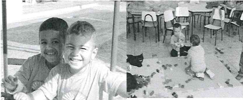
Adaptação Sala Abridq

EI02EF07), ESPAÇO, TEMPOS, QUANTIDADES, RELAÇÕES E TRANSFORMAÇÕES (EI02ET06).