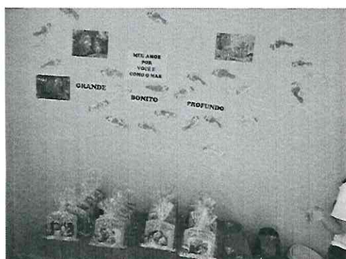
Presente do Papai

Durante todo o mês de agosto o tema desenvolvido foi sobre o Folclore . As crianças conheceram diversas histórias, desenhos, personagens e músicas. As professoras trabalharam atividades envolvendo esse assunto que é muito apreciado em nossa cultura. Para finalizar esse conteúdo, no dia 29 sob o comando do Prof o Charles, cada sala apresentou uma cantiga própria do folclore brasileiro. O EU, O OUTRO E O NÓS(EI02EO02, EI02EO06) CORPO, GESTOS E MOVIMENTOS (EI02CG02, EI02CG03, EI02CG05) TRAÇOS, SONS , CORES E FORMAS (EI02TS01, EI02TS02, EI02TS03) ESCUTA, FALA, PENSAMENTO E IMAGINAÇÃO (EI02EF02, EI02EF03, EI02EF04, EI02EF08).