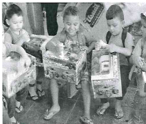
Doação de presentes por benfeitor