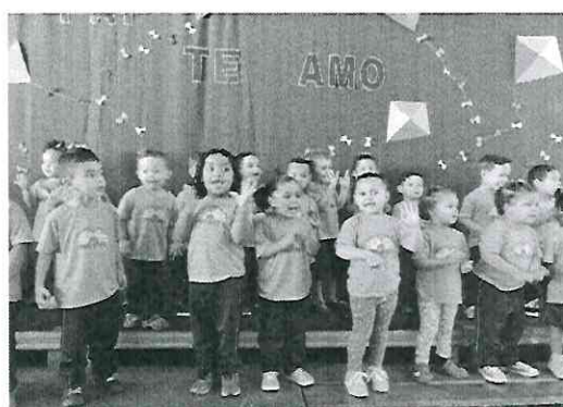
Homenagem Dia dos Pais