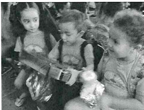
Presentes Semana da Criança

CNPJ: 78.636.974-0009-00 Centro de Educação e Assistência à Criança Raio de Sol Rua Avelino Antonio de Campos, 225 | Bairro Caetetuba Atibaia/SP | Fone 4411.0457 CEP 12951-610 | e-mail: diretoriaraiodesol@gmail.com