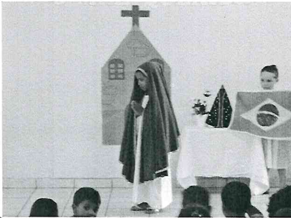
Teatro Nossa Senhora Aparecida

CNPJ: 78.636.974-0009-00 Centro de Educação e Assistência à Criança Raio de Sol Rua Avelino Antonio de Campos, 225 | Bairro Caetetuba Atibaia/SP | Fone 4411.0457 CEP 12951-610 | e-mail: diretoriaraiodesol@gmail.com