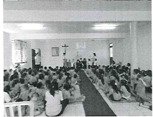
Teatro Pe. José Kentenich