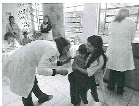
Vacinação contra o sarampo