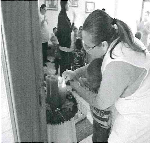
Acendendo 1ª Vela do Advento