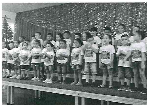
Cantata de Natal