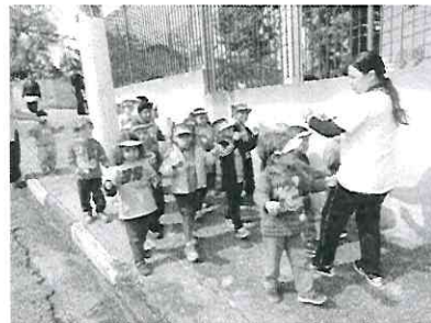
Comemoração “Dia da Pátria”