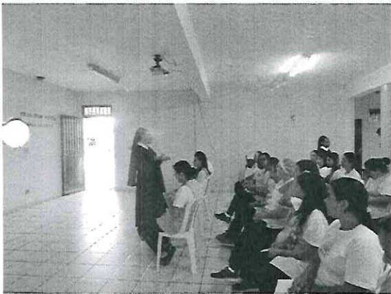
“A Arte de Aprender”

Neste dias os funcionários participaram de palestras em todas as manhãs e durante a tarde, fizeram a organização de suas respectivas salas de aula.