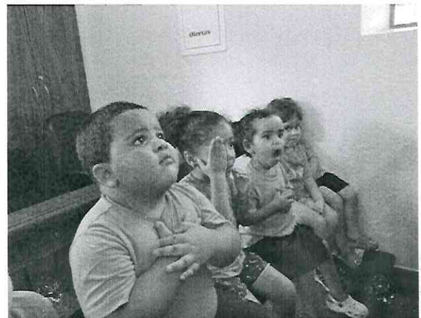
Visita ao Santuário de Schoenstatt