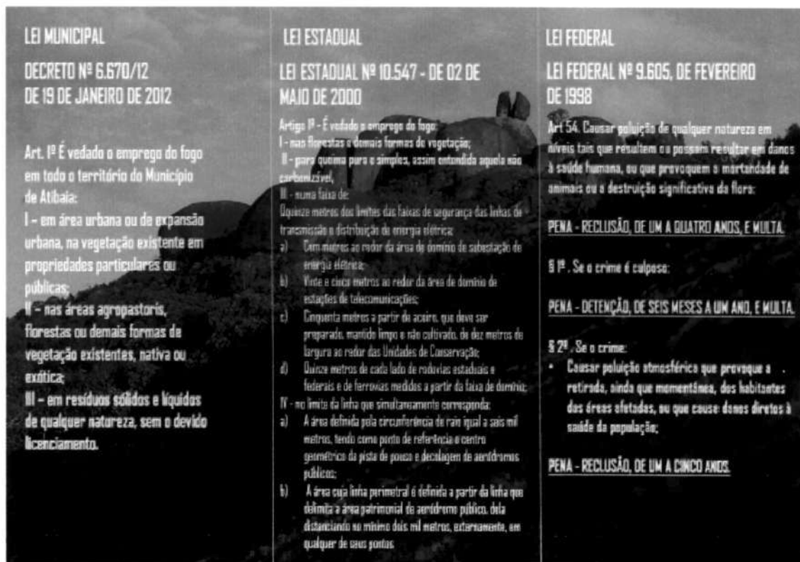
Cartilha 2 Verso