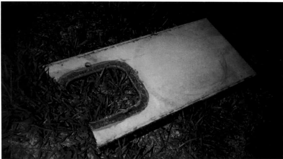
Foto 16 e 17 Pia Quebrada Na Tentativa de Assalto