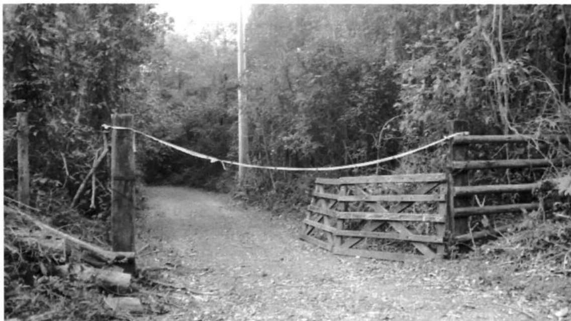
Foto 15 Porteira Arrebetada