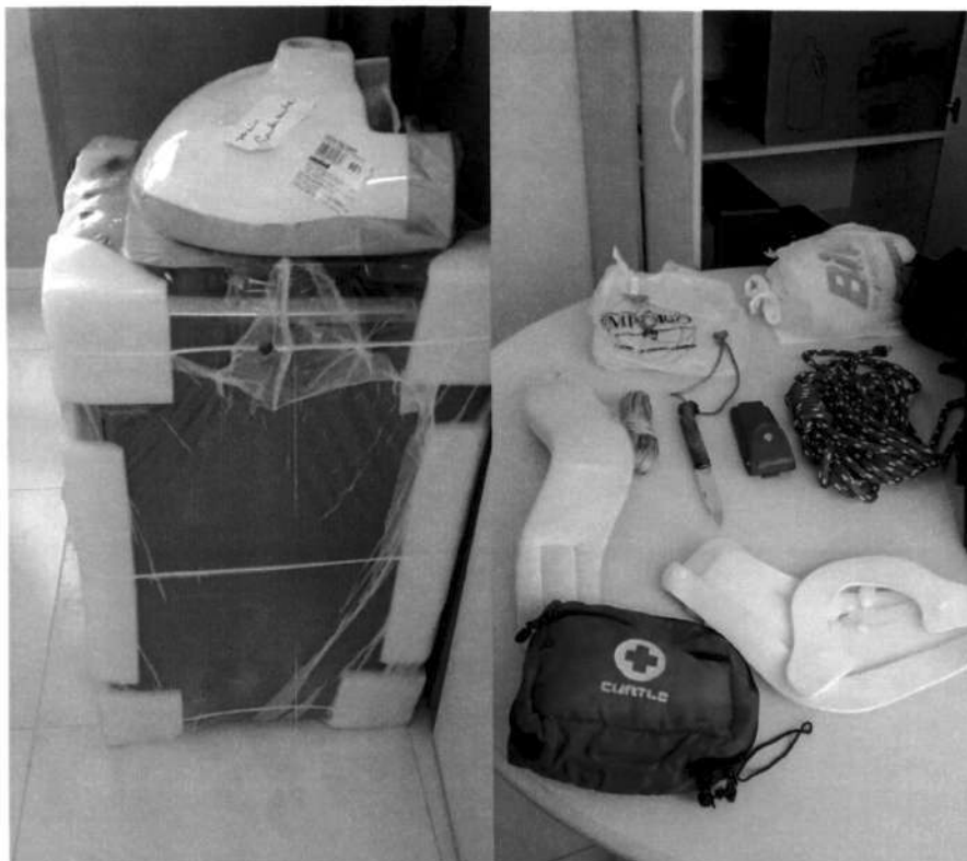
Foto 1 a 14 Materiais Alocados Na CEMA

c) Instalar internet e telefone; instalar sistema de alarme do Parque; acompanhar funcionalidade do sistema de alarme, bem como acionar empresa e CEMA em caso de sinistro ou por razões de manutenção.