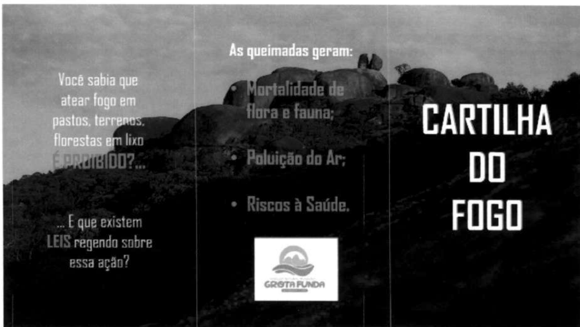
Cartilha 1 Frente