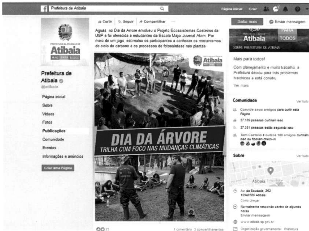
Foto 18 Dia da Árvore

No dia 21 de setembro de 2018, participamos do Dia da Árvore, no qual a USP promoveu uma Trilha de Mudanças Climáticas para os Alunos da Escola Estadual Major Juvenal Alvim.