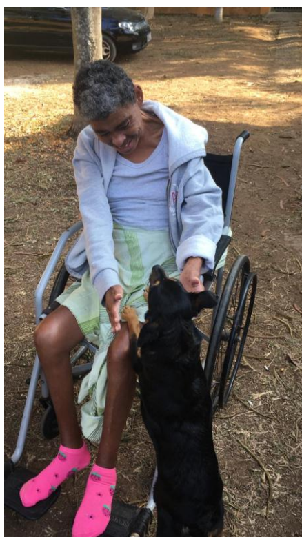
Rotina diária dos moradores