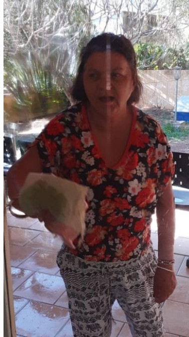
Rotina diária – autonomia