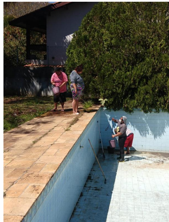
Rotina da residência – Trabalho em equipe.