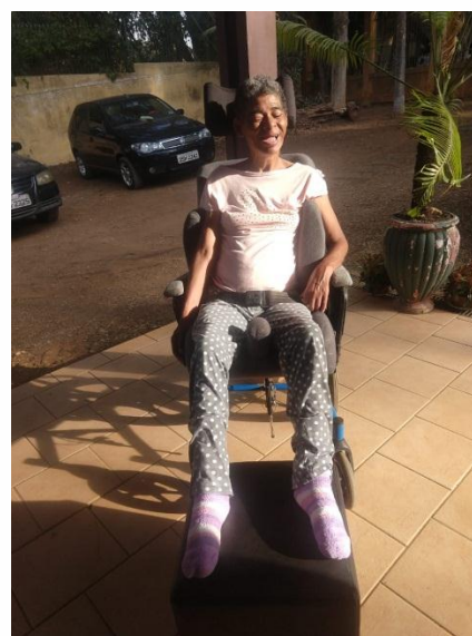
Rotina diária dos moradores