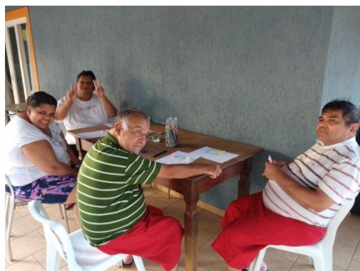
Atividades realizadas em grupo com a fisioterapeuta relacionadas à cognição