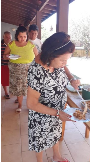
Início da implantação do self-service