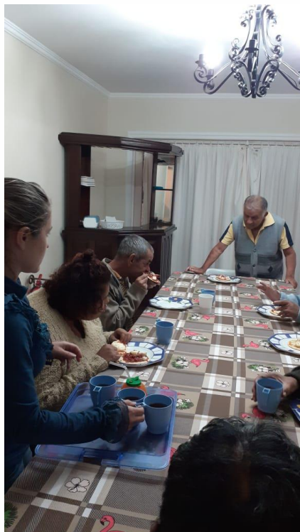
Noite da pizza