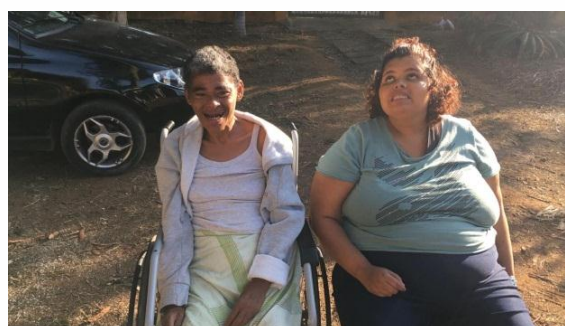
Rotina diária dos moradores