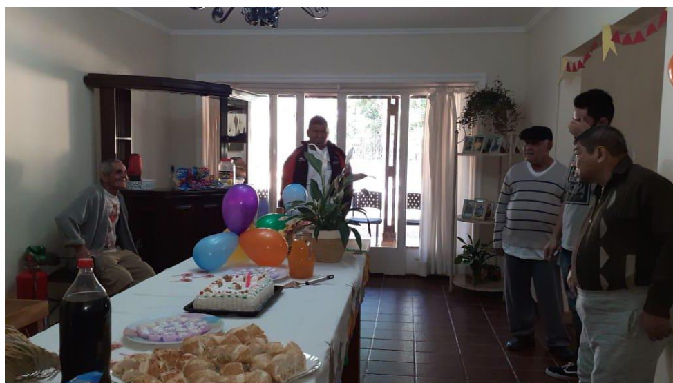
Confraternização dos aniversariantes de Julho