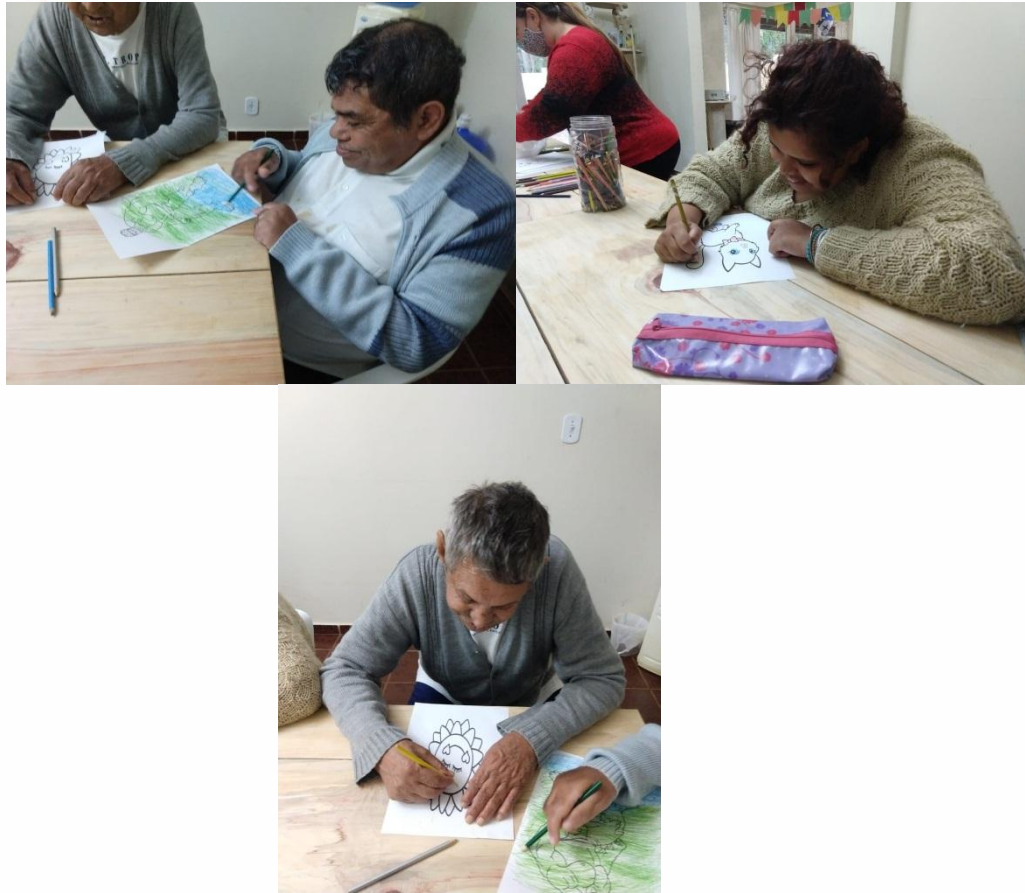
Atividades realizadas em grupo com a fisioterapeuta relacionadas à cognição