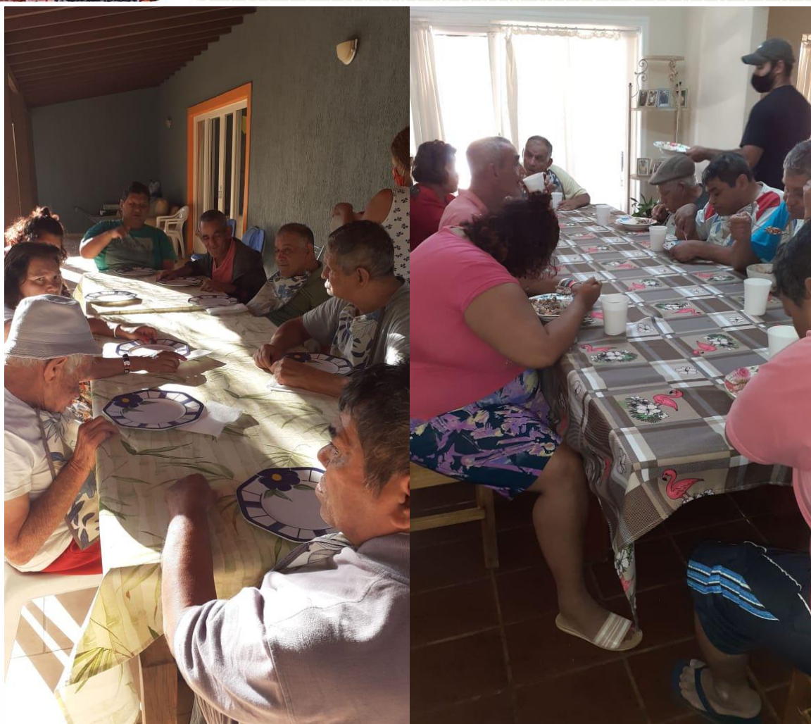
Rotina diária dos moradores