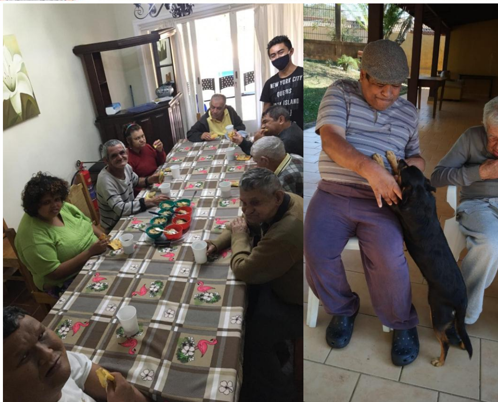
Rotina diária dos moradores