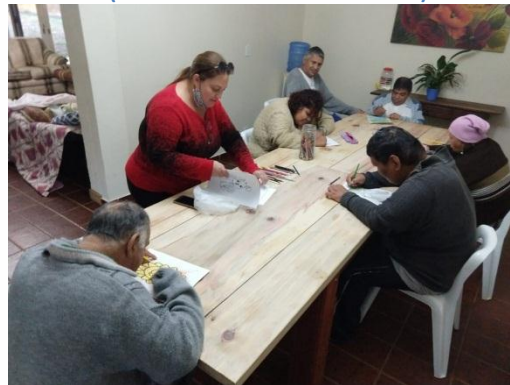
Atividades realizadas em grupo com a fisioterapeuta relacionadas a cognição