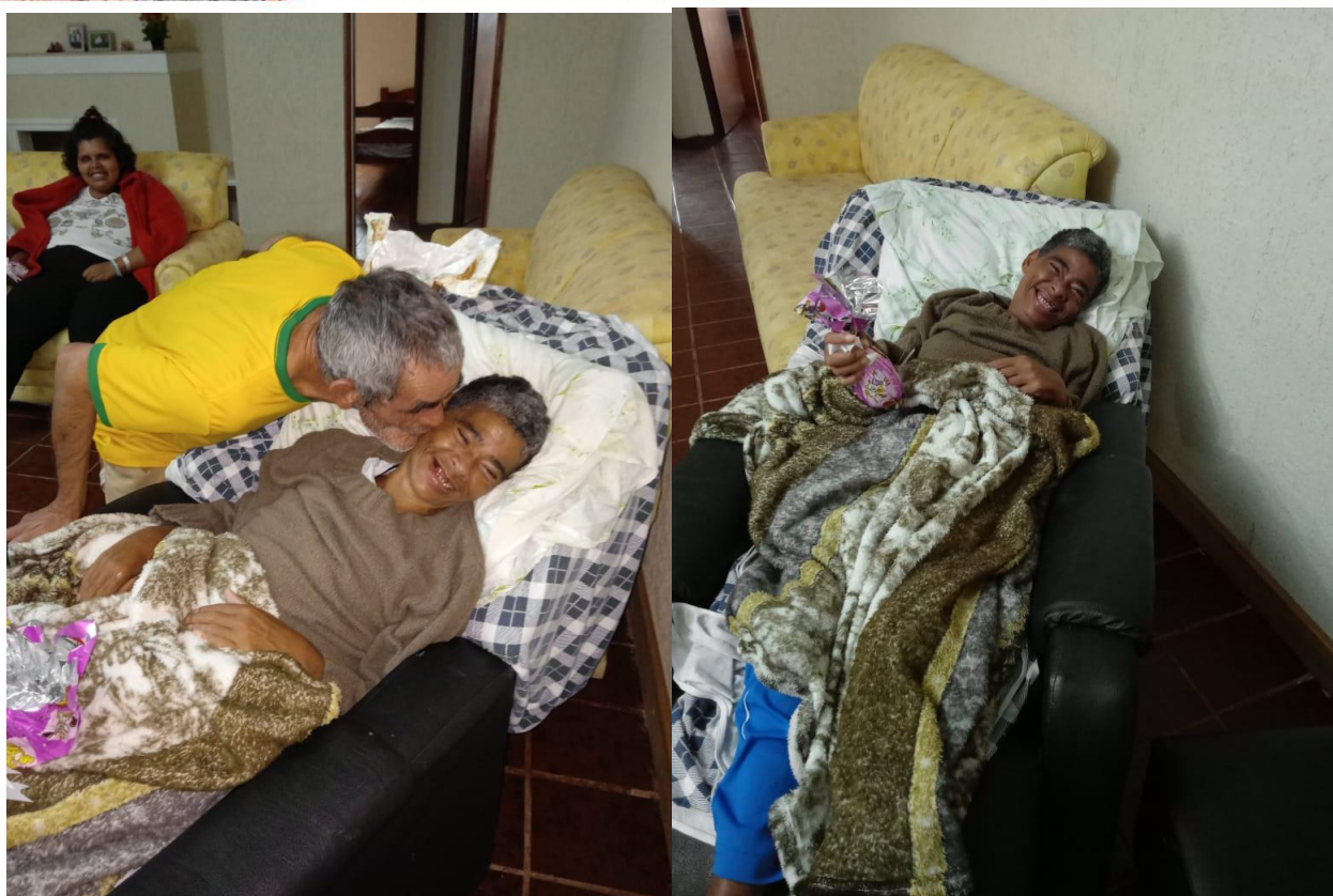
Rotina diária dos moradores