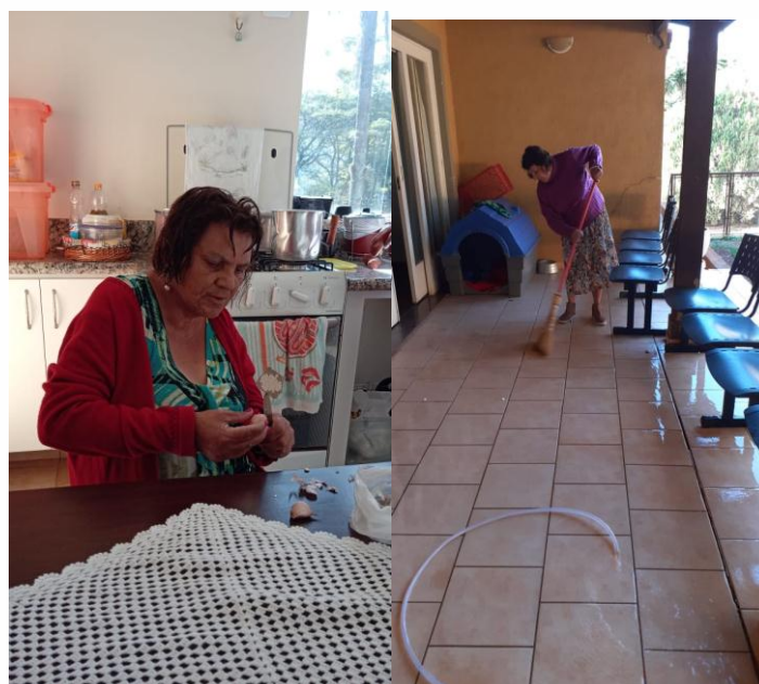
Autonomia diária dos moradores.