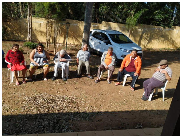
Rotina diária dos moradores