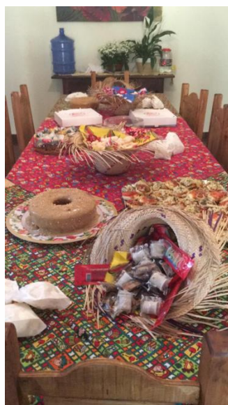
Confraternização dos aniversariantes de junho, festa junina e despedida de voluntários.