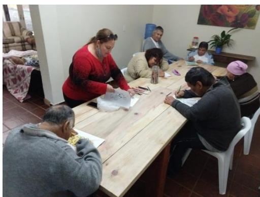
Fisioterapia cognitiva em grupo