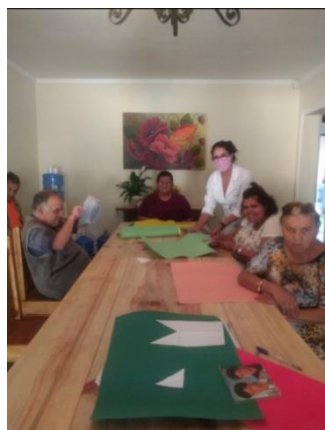
Fisioterapia cognitiva em grupo