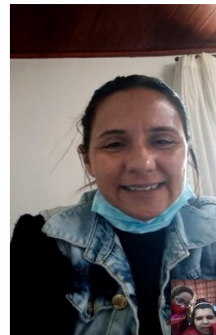
Contato eletrônico com amigos (referência).