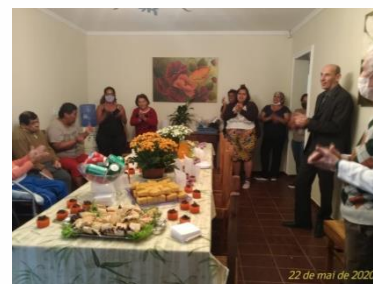
Confraternização de "Casa Nova".