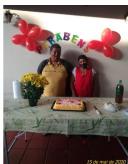
Confraternização dos aniversariantes de maio.