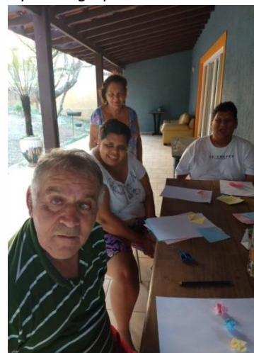
Fisioterapia cognitiva em grupo