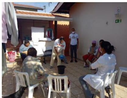
Fisioterapia em grupo.