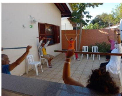
Fisioterapia em grupo