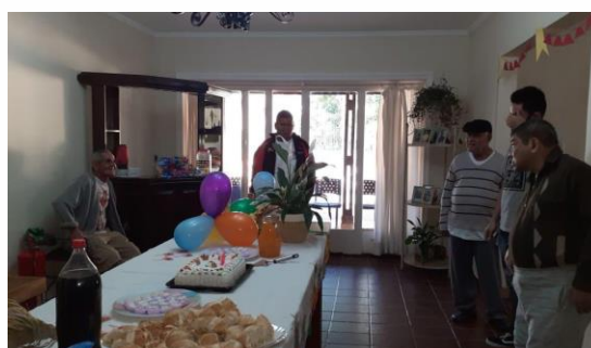
Confraternização dos aniversariantes de julho.