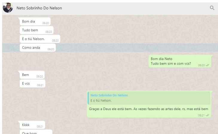
Contato eletrônico através da coordenação.