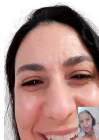
Contato eletrônico com a família.