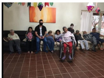
Visita de voluntários para corte de cabelo