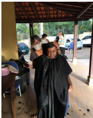
Visita de voluntários para corte de cabelo