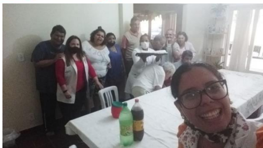
Confraternização dos aniversariantes de agosto