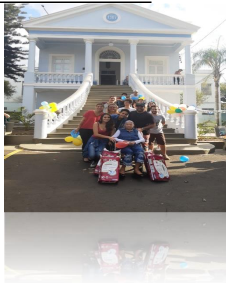
Aniversário de 114 anos do Lar dos Velhos. Participação de alunos E.E Dr. 'Coriolano Burgos' e comunidade.