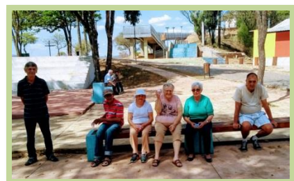
Passeio externo: Pique Nique no Cristo Redentor de Amparo.