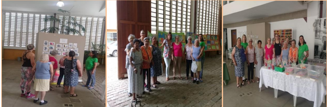
Visita na Exposição Artística da APAE-AMPARO.