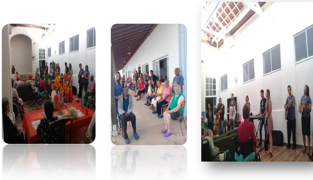
Visita Comunidade Evangélica: Mistério de Belém.