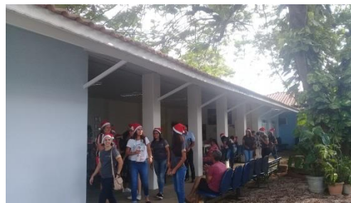
Ação Empresa de Amparo: HTM ELETRÔNICA.