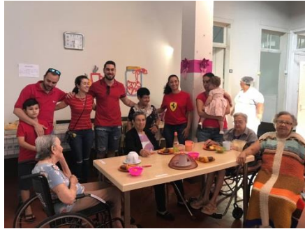
Ação equipe Banco Santander