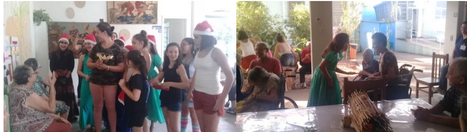
Apresentação Teatral : Fundação São Pedro.