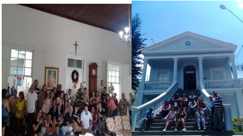
Visita alunos Programa escola da Família: Escola Estadual Paulo Turolla.