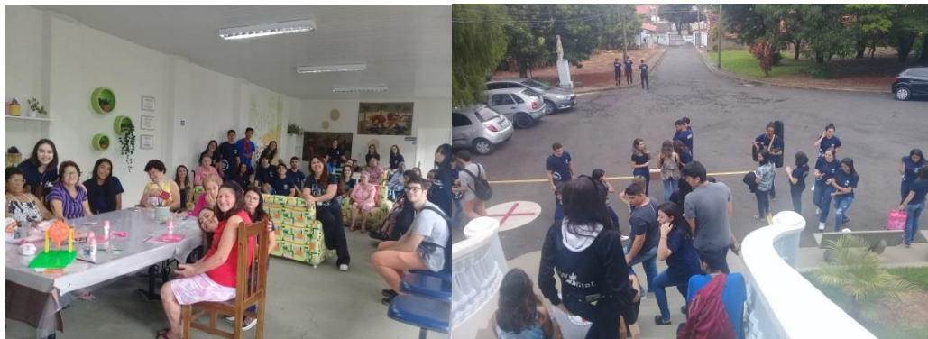
Ação dos alunos :ESPRO –Ensino Social profissionalizante.