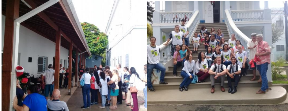
Visita comunidade cristã : Igreja de Jesus Cristo dos Santos dos últimos Dias.