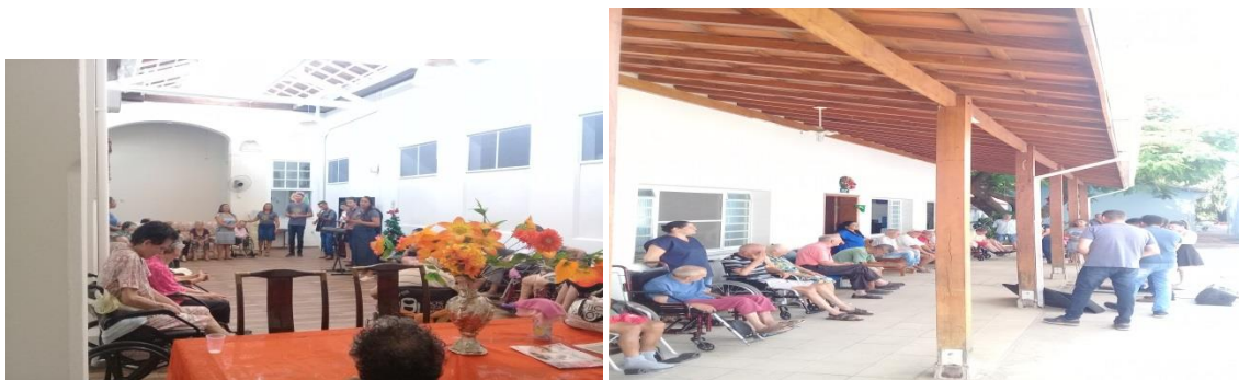
Visita comunidade evangélica: Ministério de Belém.