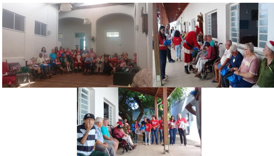
Ação Natal Mágico Acea- AMPARO