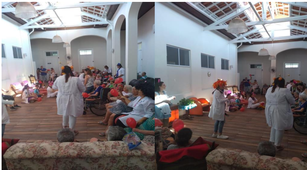
Ação Enfermeiras da Alegria (Curso de enfermagem – UNIFIA AMPARO).