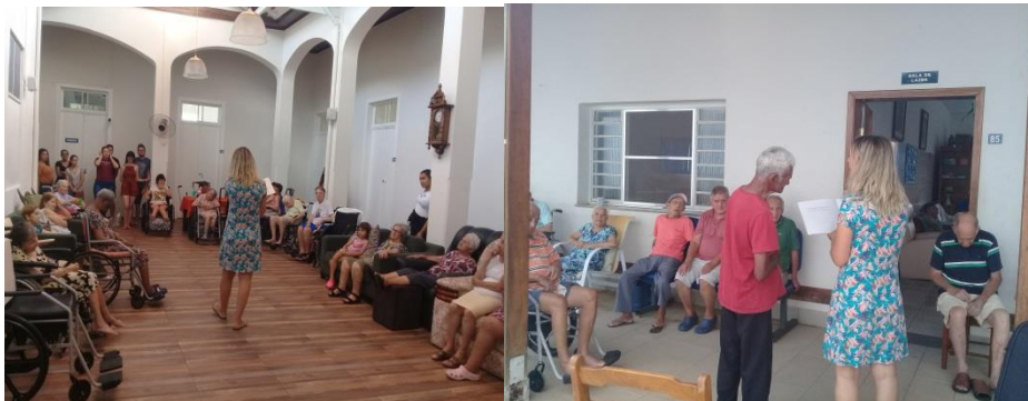
Grupo de voluntários : Tarde de contação de histórias.