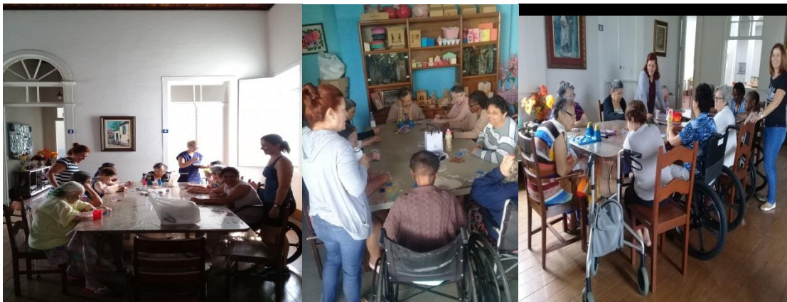
Oficina da memória: Momentos de ler, lembrar, reescrever as próprias vivências.