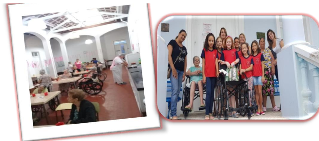
Atividade: Comemoração aniversariantes e visita do grêmio estudantil da E.E Professor “Fernando Barbosa” gesto de generosidade e amor pelos idosos.