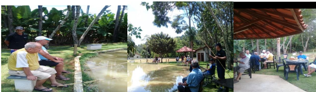
Atividade externa : Passeio em pesqueiro com pequeno grupo.