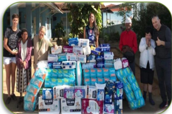
Diversas campanhas de doações.