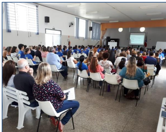
Conferência Municipal 2019: Direito do Povo, com Financiamento Público e Participação Social.