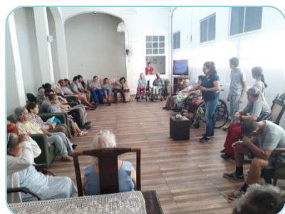
Visita alunos APAE / Varal de Fotos Lar dos Velhos

Ações foram seqüenciadas conforme cronograma do Plano de Trabalho.