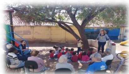
Projeto CIME Bambi