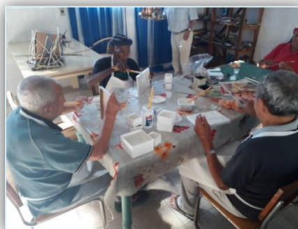
Oficina Arte e Artesanato