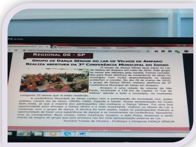
Apresentação Dança Sênior