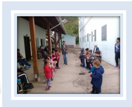
Projeto CIME Bambi