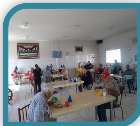
Aniversariantes do mês.