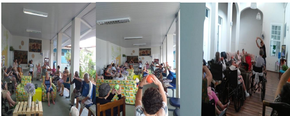
Dança Sênior e Atividade física