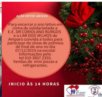
Ação Promovida pela Escola Estadual “ Dr. Coriolano Burgos”