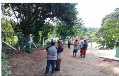
Passeio externo “ Projeto Promovendo a Cidadania Associação das Damas de Caridade – Amparo”