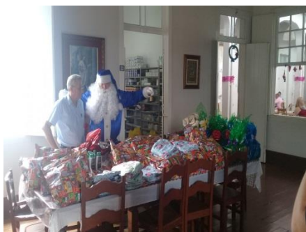
Ação da Guarda Municipal de Amparo.

As ações foram seqüenciadas conforme cronograma do Plano de Trabalho.