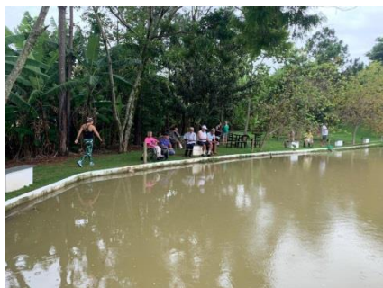
Passeio externo “Pesqueiro Serrano”