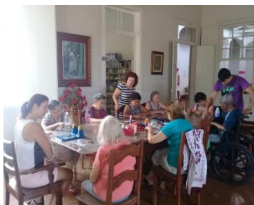
Oficina da Memória