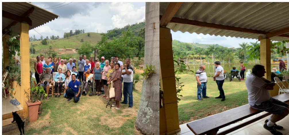
Passeio externo “ Sítio família Rossi – Monte Alegre do Sul.