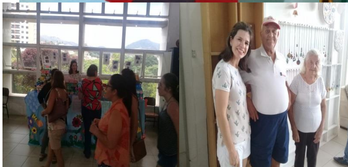
Evento de amostras dos Projetos de Arte “ Fundação São Pedro”.