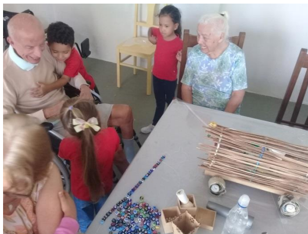
Projeto Intergeracional CIME BAMBI