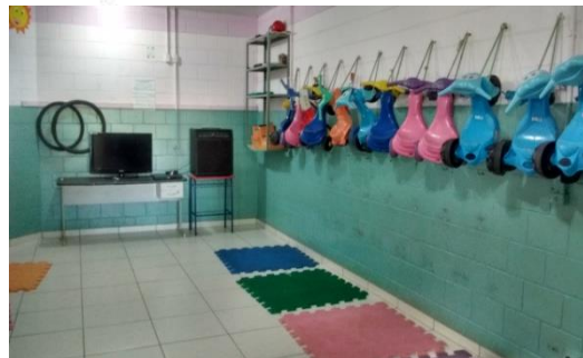
Sala de TV/Brinquedoteca