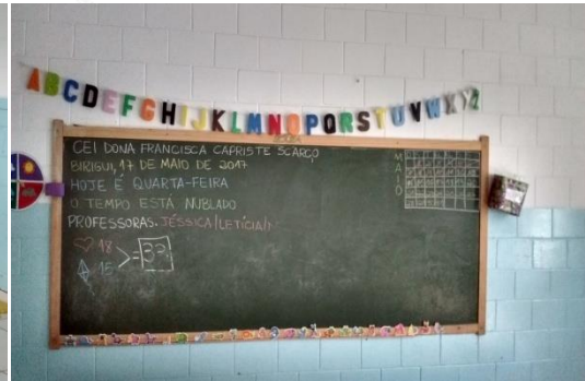
Sala de Aula