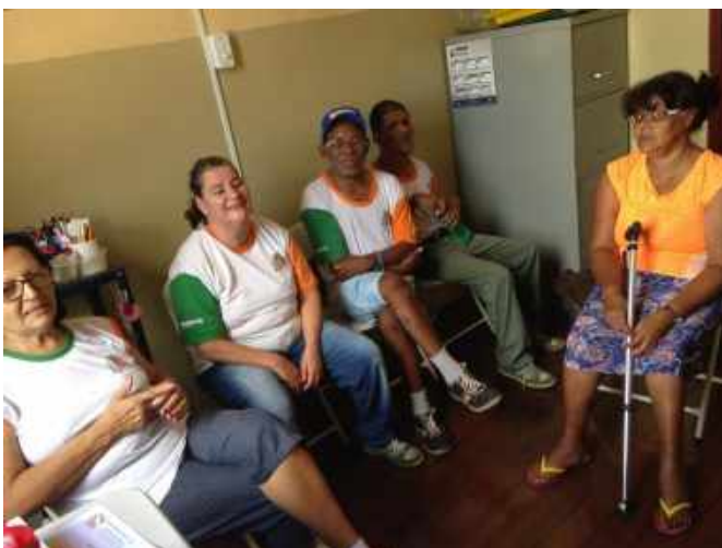
GRUPO DE ATENDIMENTO