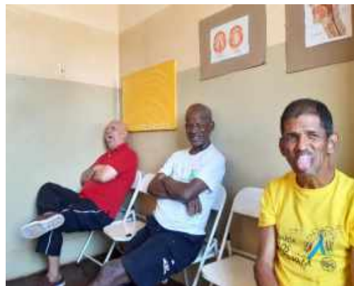
GRUPO DE ATENDIMENTO