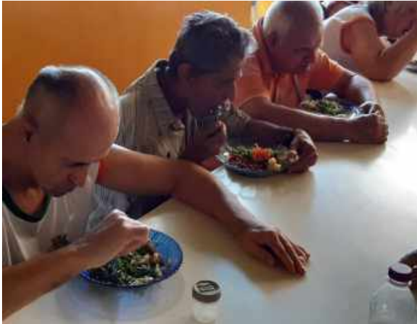
ACOMPANHAMENTO DURANTE REFEIÇÃO

FUNDADA em 21.09.1994 - CNPJ 00947.072/0001-40 Rua 20, n.º 1140 - Centro - CEP 14780 - 070 - Barretos Telefone: (0xx17) 3322 – 9608