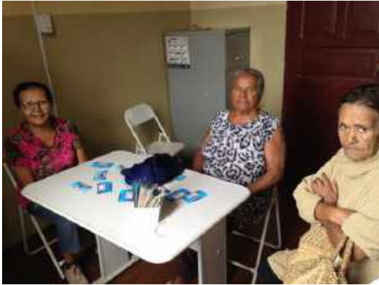
GRUPO DE ATENDIMENTO (NOMEAÇÃO)

FUNDADA em 21.09.1994 - CNPJ 00947.072/0001-40 Rua 20, n.º 1140 - Centro - CEP 14780 - 070 - Barretos Telefone: (0xx17) 3322 – 9608