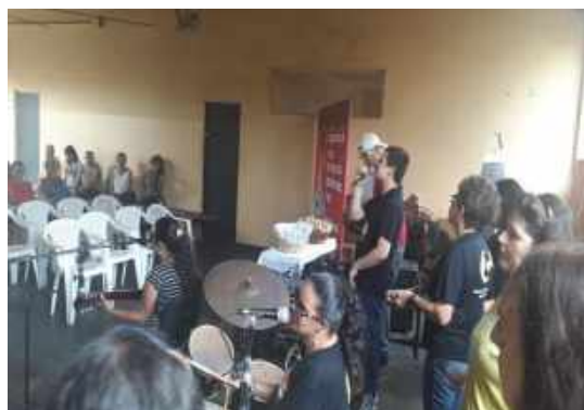
- Apresentação da Bandavin CDI .