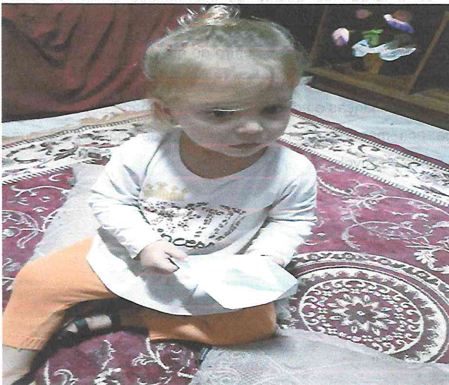
Vivencia do Barquinho de Papel