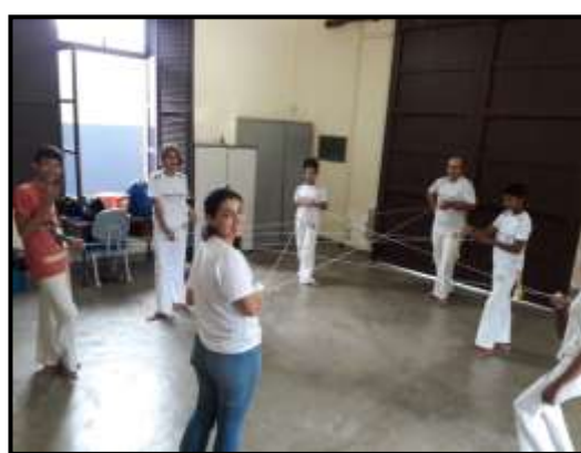
CAPOEIRA – JANEIRO, FEVEREIRO, MARÇO E ABRIL / 2020