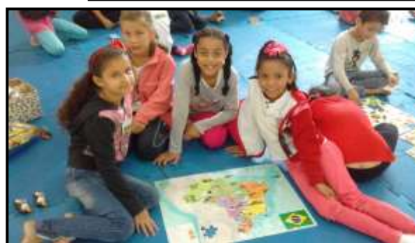
ATIVIDADES RECREATIVAS – JANEIRO, FEVEREIRO, MARÇO E ABRIL / 2020