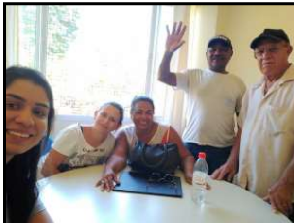
VIOLÃO – JANEIRO, FEVEREIRO, MARÇO E ABRIL / 2020