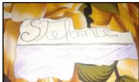
ARTES EM TECIDOS – JANEIRO, FEVEREIRO, MARÇO E ABRIL / 2020