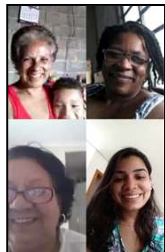
ARTESANATO – JANEIRO, FEVEREIRO, MARÇO E ABRIL / 2020