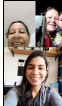
CANTO – JANEIRO, FEVEREIRO, MARÇO E ABRIL / 2020