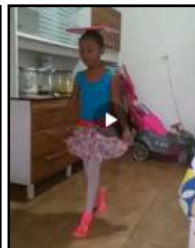
DANÇA – JANEIRO, FEVEREIRO, MARÇO E ABRIL / 2020