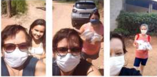
Entrega dos Kit's