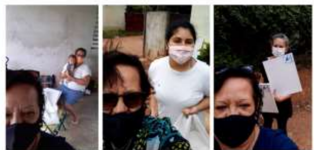
Entrega dos Kit's