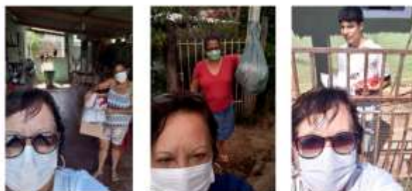
Entrega dos Kit's