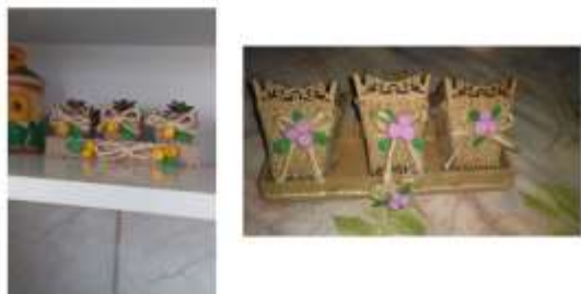
SEMANA 1- DE 05/10 a 09/10