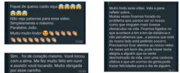
SEMANA 4 - DE 23/11 a 27/11