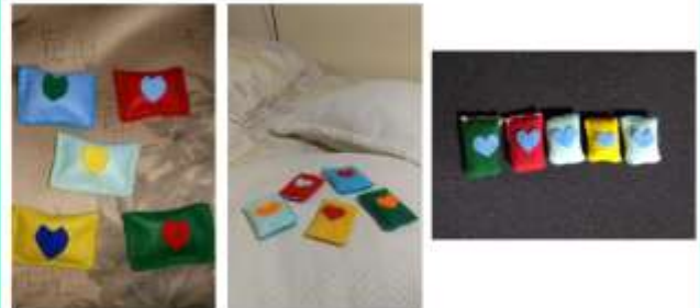
SEMANA 1 - DE 02/11 a 06/11