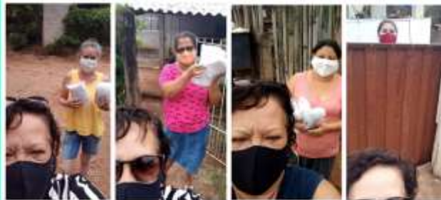
Entrega dos Kit's