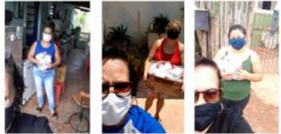
Entrega dos Kit's