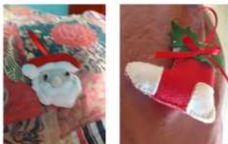
SEMANA 1 - DE 30/11 a 04/12