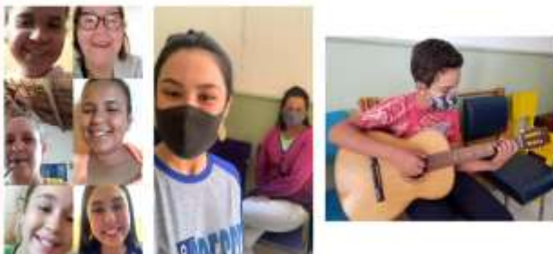
SEMANA 1 - DE 02/11 a 06/11