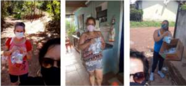
Entrega dos Kit's