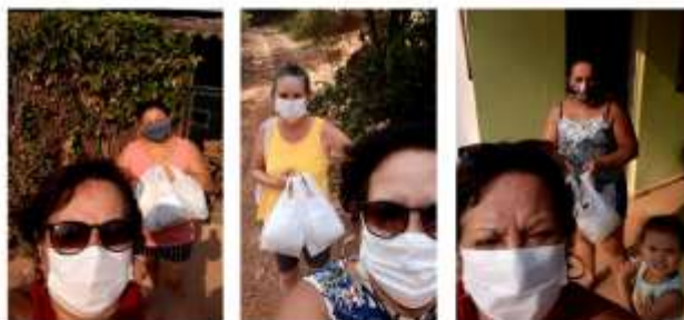
Entrega dos Kit's