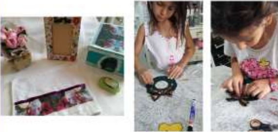
SEMANA 2 - DE 07/12 a 11/12