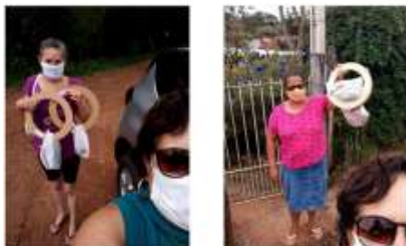
Entrega dos Kit's