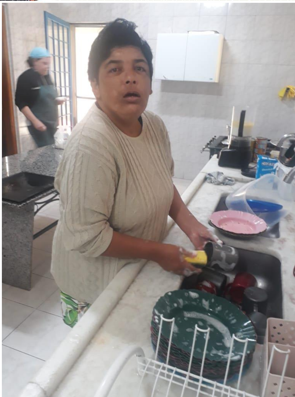
Treino de AVDs – abril/2020.