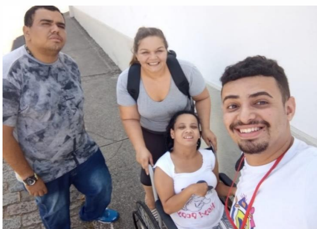
AVDs Compras no centro da cidade – janeiro/2020