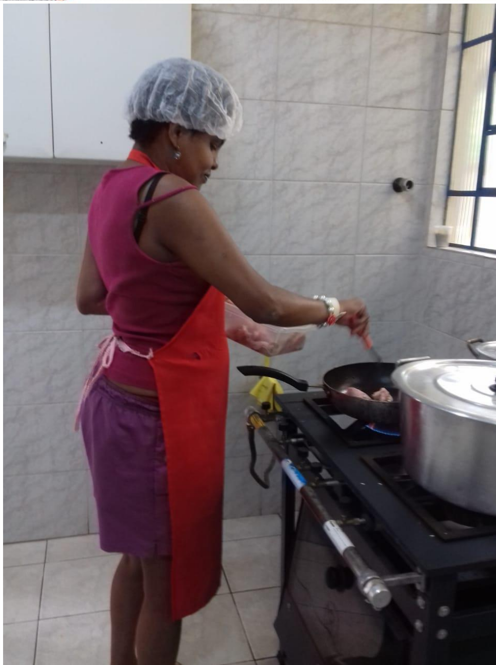
Treino de atividade de vida diária – AVD