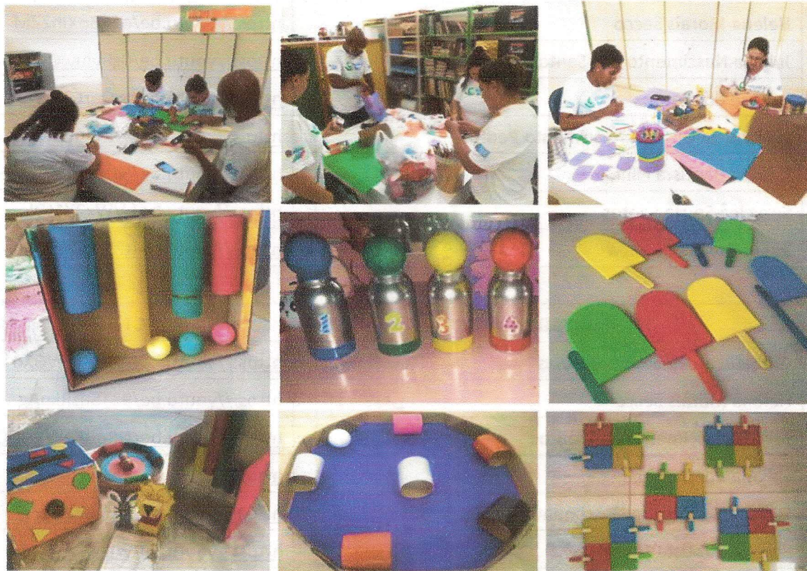
Produção de brinquedos sustentáveis durante o período de isolamento social no mês de abril – Cecília Hernandes 04/2020