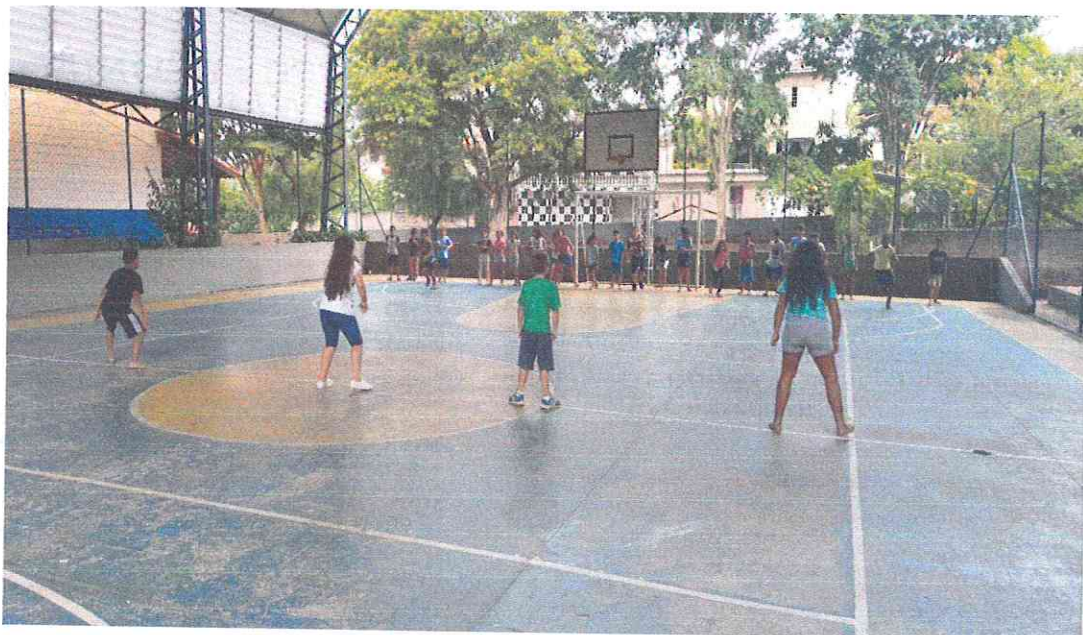
PSICOMOTRICIDADE E RECREAÇÃO