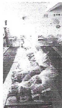
Entrega de cestas básicas