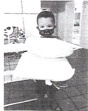
Doação de travesseiros e cobertas