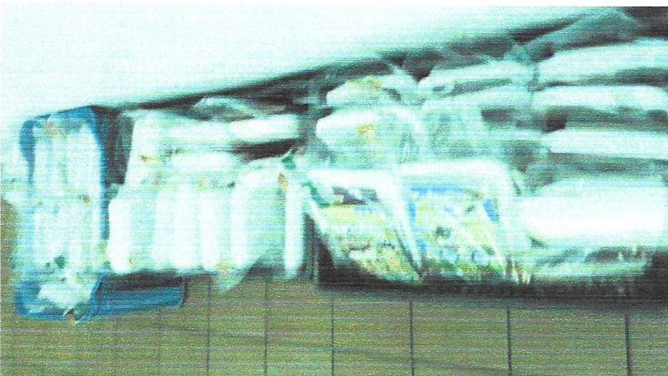
ENTREGA DE "KITS" PARA ATIVIDADES REMOTAS