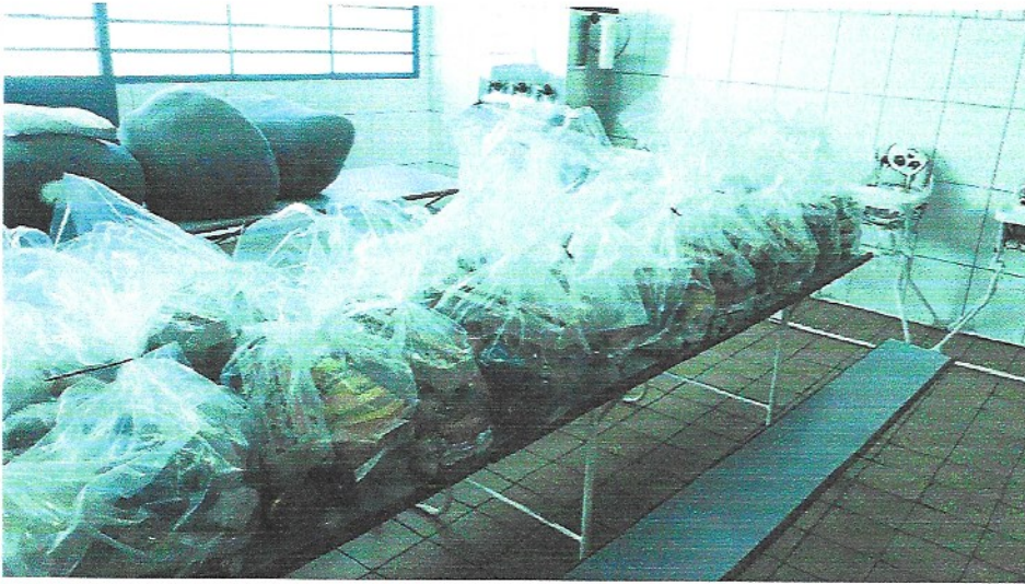
ENTREGA DE CESTAS BÁSICAS