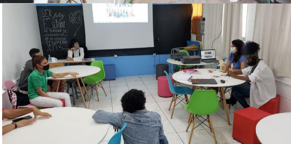
Sarau Empoderando Ideias – Diversidade