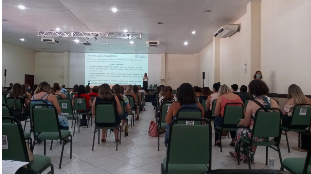
Reunião preparação para o retorno presencial.