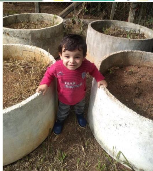
Primeiro dia de aula , fevereiro