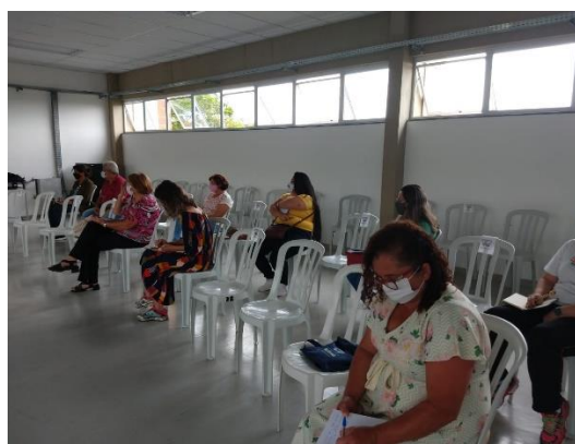
Reunião para ajustes e esclarecimento de todas as dúvidas e anseios.