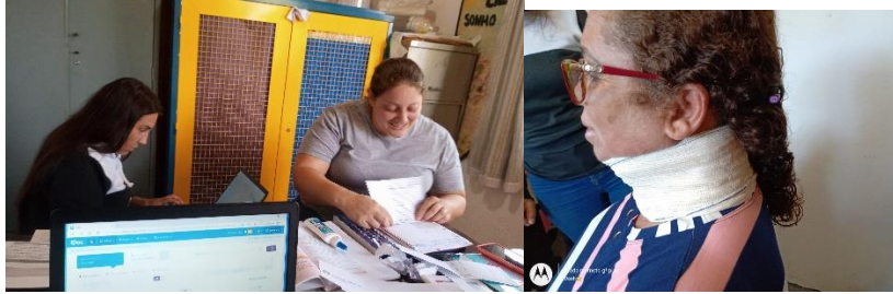
Reunião com as educadoras