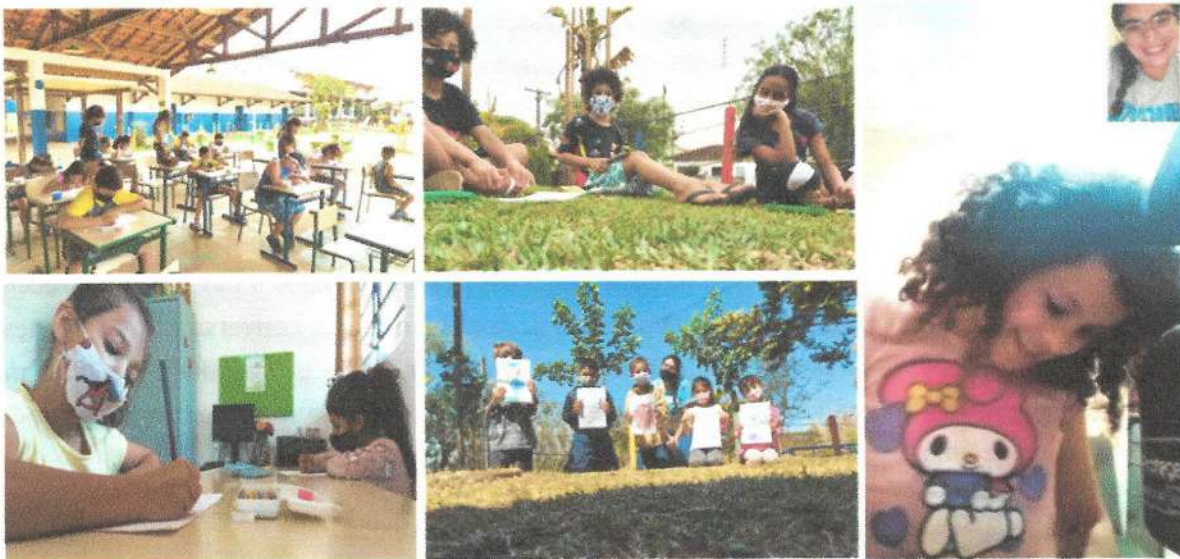
Ação grêmio estudantil set.2021

Objetivo da atividade: Oferecer o atendimento de um especialista às pessoas com dificuldades de resolverem por elas mesmas os seus conflitos sociais. Também visa prevenir os atos de violência, orientando os atores envolvidos, a resolverem, posteriormente, eles mesmos os seus conflitos, desenvolvendo a formação para convivência.