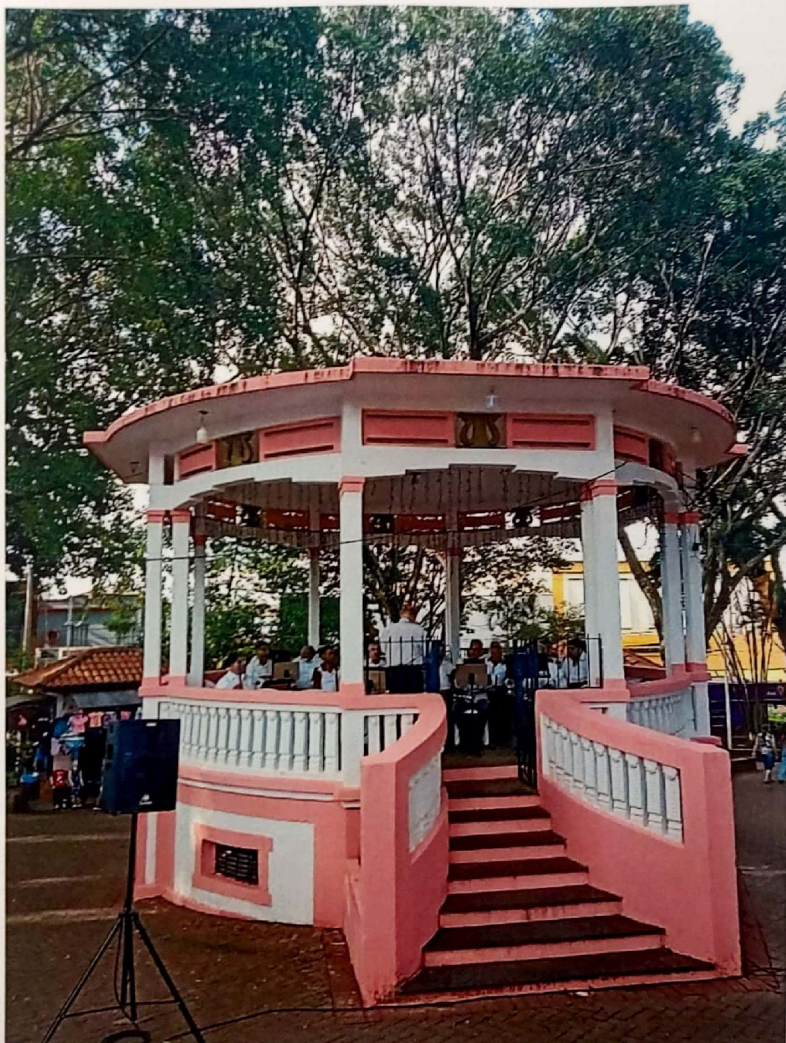
Ciclo Natalino Atibaia 2021

Sede Própria: Rua Dr. Alvaro Correia Lima, 91 – CEP 12953-162 - Atibaia/SP