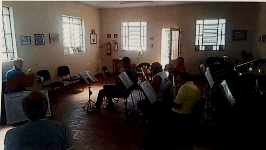
Ensaio da Corporação Musical 24 de Outubro