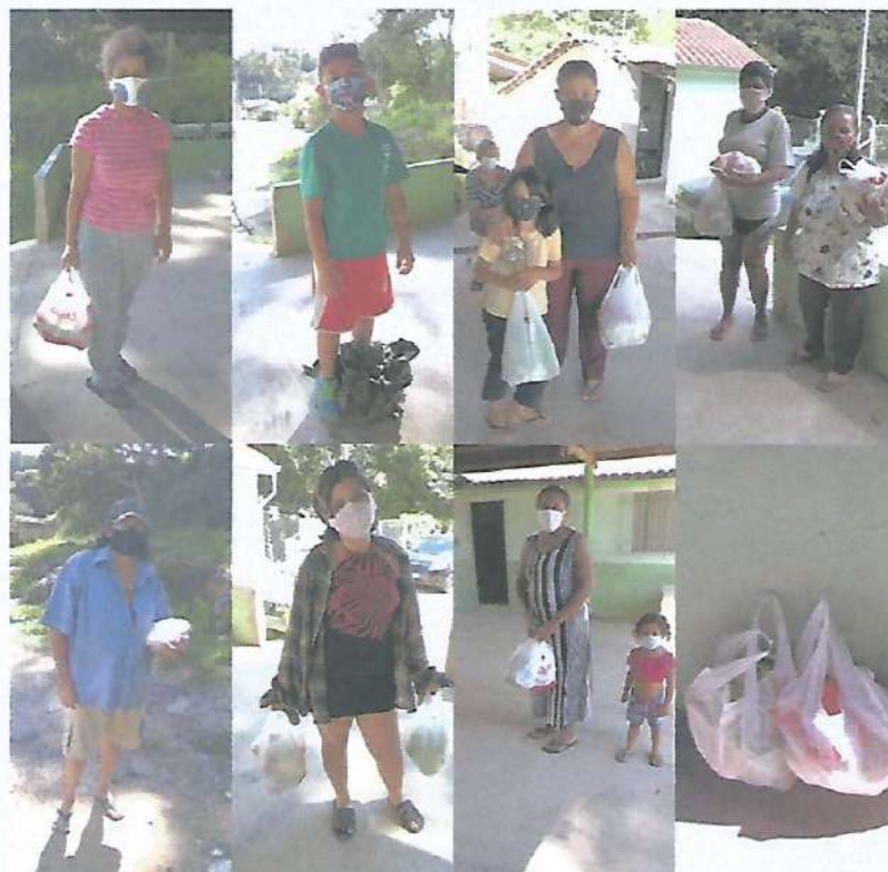
DOAÇÕES ENTREGUES ÀS FAMÍLIAS

Por estas razões, montamos um kit com todas as atividades impressas, de forma lúdica, e entregamos aos usuários com a intenção de incentivá-los a participar.