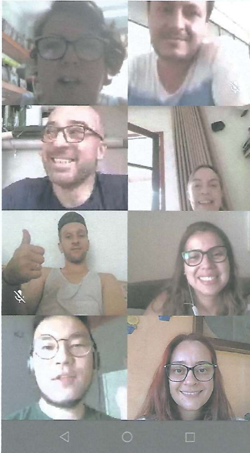
REUNIÃO DE EQUIPE

RUA DONA RITINHA, Nº 5 - CEP 13800-170 - AMPARO - ESTADO DE SÃO PAULO - FONE: (19) 3807-3004