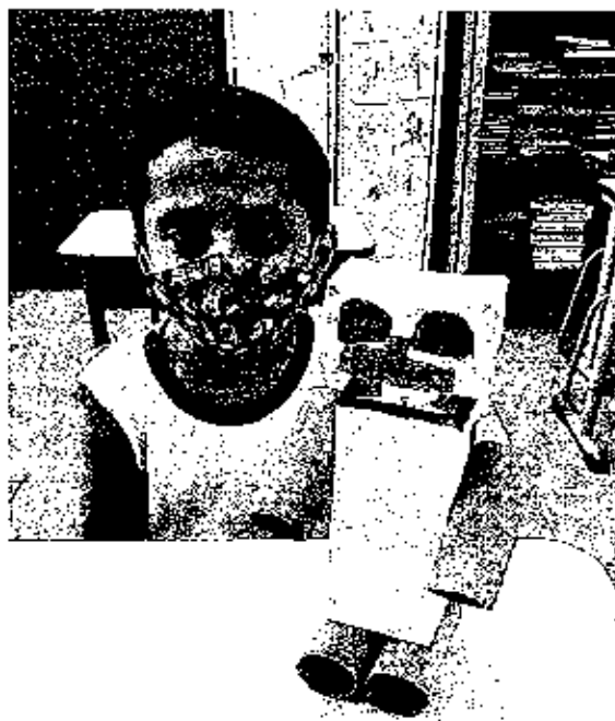
FOTO10: DISCIPLINA DE LIAP (PROJETO JEEP- RECICLAGEM)