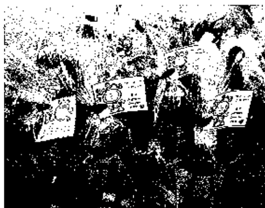
FOTO 7: LEMBRANCINHAS ENTREGUES, CONFECCIONADAS COM RECURSOS PRÓPRIOS.