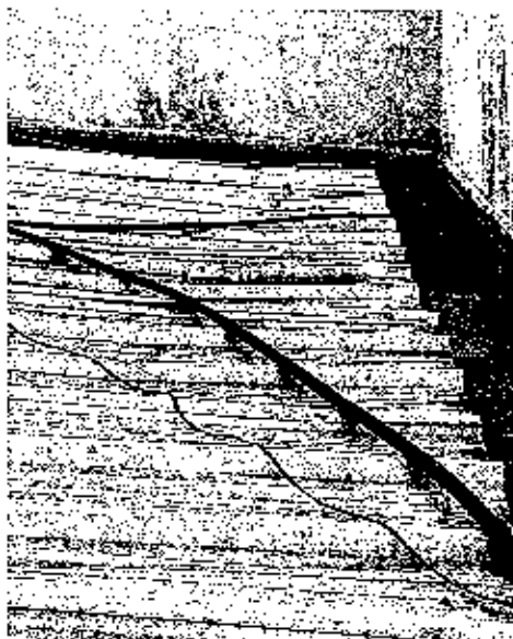
FOTO5: ANTES (TELHAS DANIFICADAS COM OTEMPO)