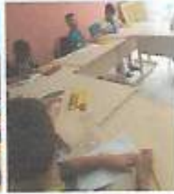
Atividades Recreativas – OSC Espaço Crescer