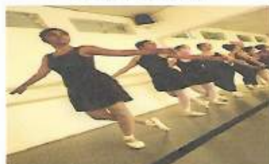
Oficina Dança – OSC Espaço Crescer