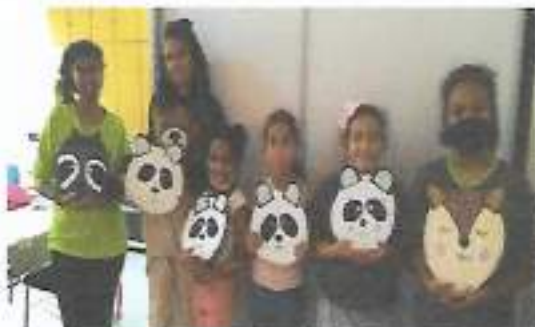
Oficina de Artes em Têxtilo – OSC Espaço Crescer