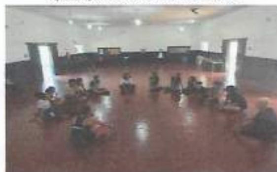
Oficina Rítmica – Roda de Conversa - Boa Vista