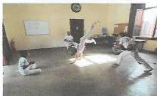
Oficina de Capoeira – CRAS Tanque