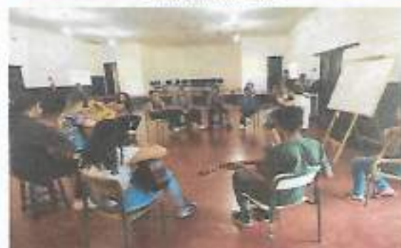
Oficina Violão - Adolescentes - Boa Vista