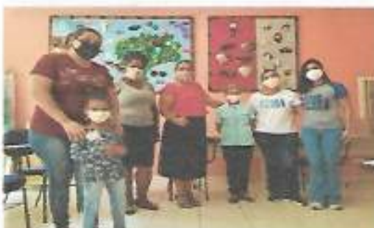
Grupo Mulheres - Turma Tarde