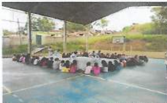
Apresentação Oficina de Capoeira E.E. Maria do Carmo