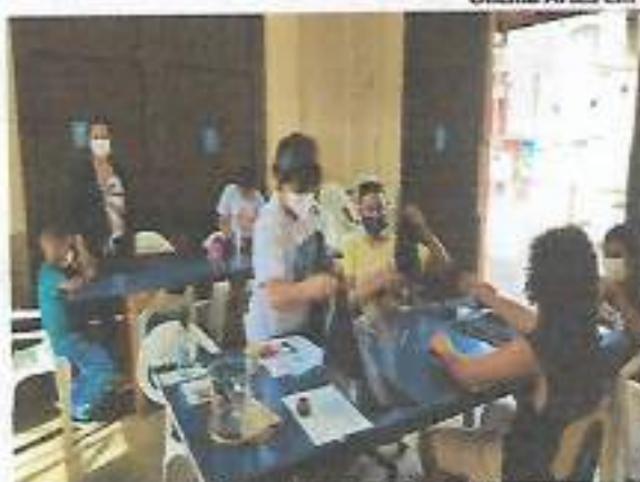
Oficina Artes em Tecido – CRAS Tanque