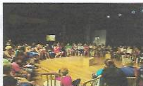
Peça Teatral: Vi-o-lar - Cine Nã