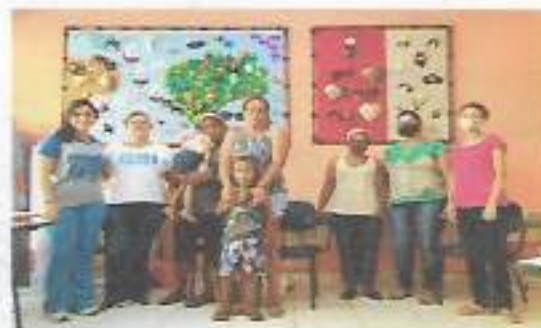
Grupo Mulheres - Turma Manhã