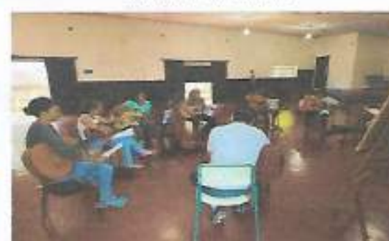
Oficina Violão - Adultos - Boa Vista