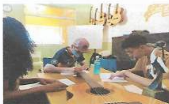
Oficina Violão – OSC Espaço Crescer