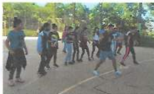
Vivência com os adolescentes