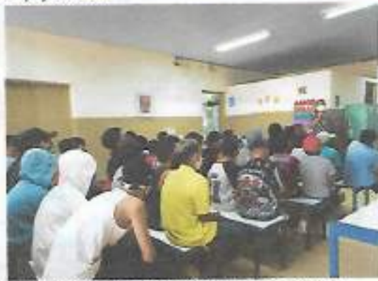
Equipe USF Boa Vista – “Prevenção de Gravidez na Adolescência”- E.E. Constantino Simões de Lima