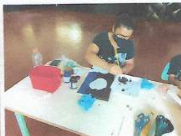
Oficina Artesanato – Boa Vista