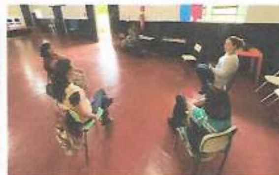
Roda de Conversa: Oficina Canto - Bairro Boa Vista