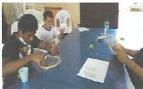
Oficina Artes em Tecido – CRAS Tarque