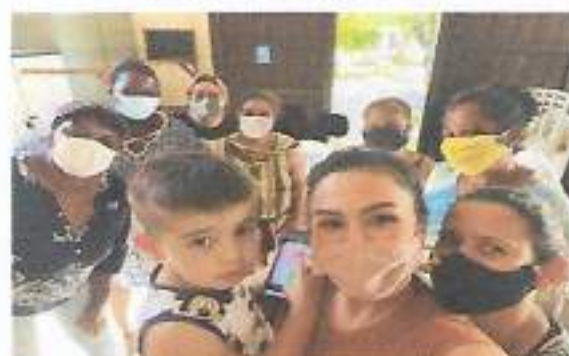
Oficina Canto – CRAS Tarque