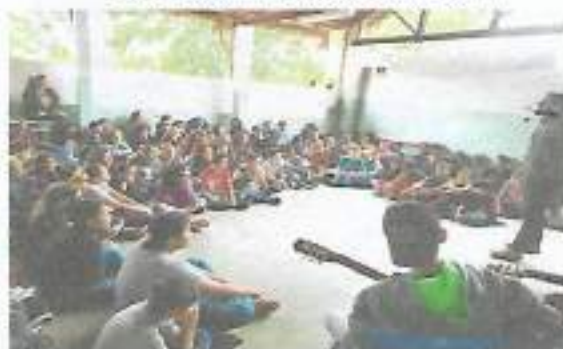
Apresentação Oficina de Violão E.E. Maria do Carmo