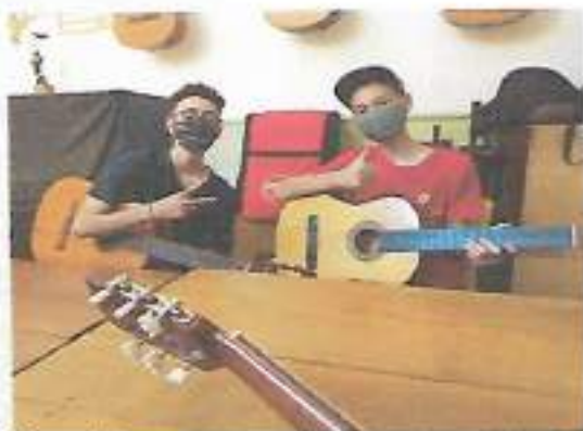
Oficina Violão – OSC Espaço Crescer