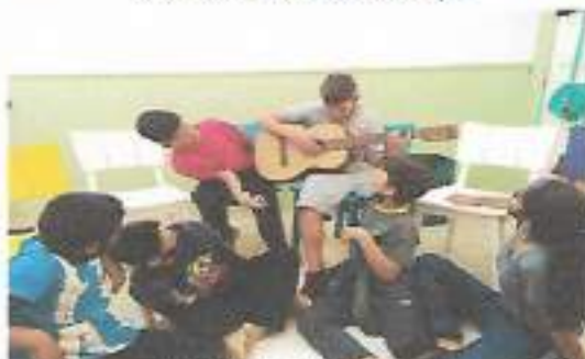
Oficina Violão – OSC Espaço Crescer