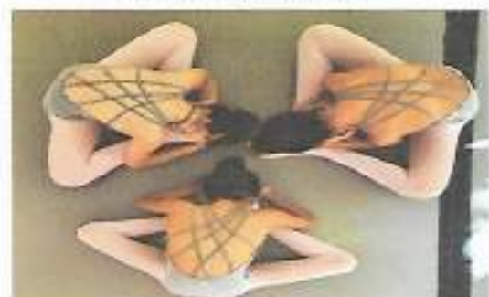
Oficina Dança – OSC Espaço Crescer