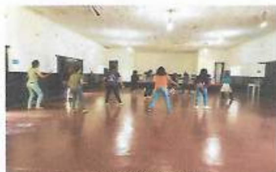
Oficina Rítmica – Boa Vista