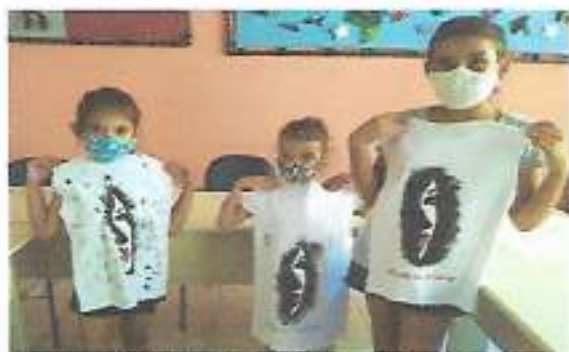
Oficina Artes em Tecido – OSC Espaço Crescer