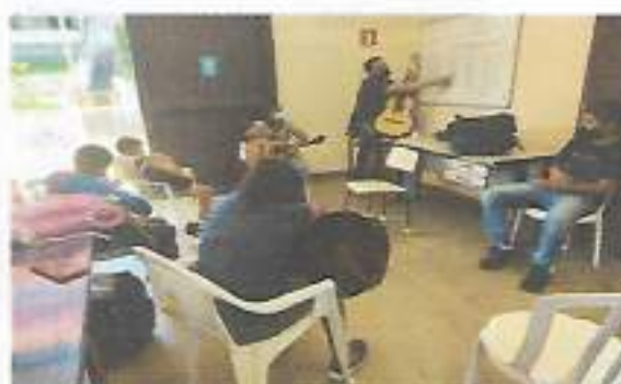
Oficina Violão – CRAS Tarque