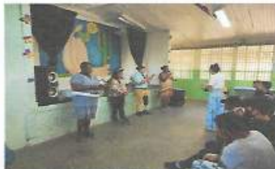
Apresentação Oficina de Canto E.E. Maria do Carmo