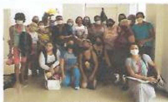
Beneficiárias do SCFV - Cine Itã