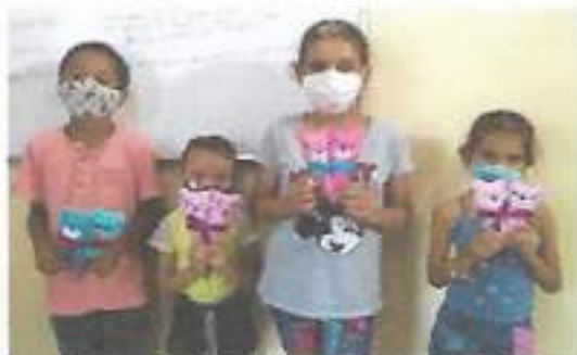
Oficina de Artes em Têxtilo – CRAS Tanque