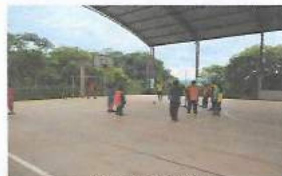
Oficina Futsal - Bairro Boa Vista