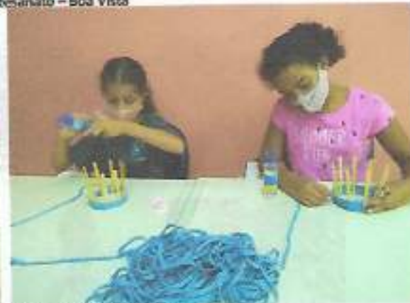
Oficina Artes em Tecido – OSC Espaço Crescer