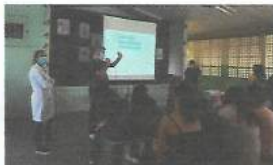
Equipe UBS Tanque - "Prevenção de Gravidez na Adolescência"