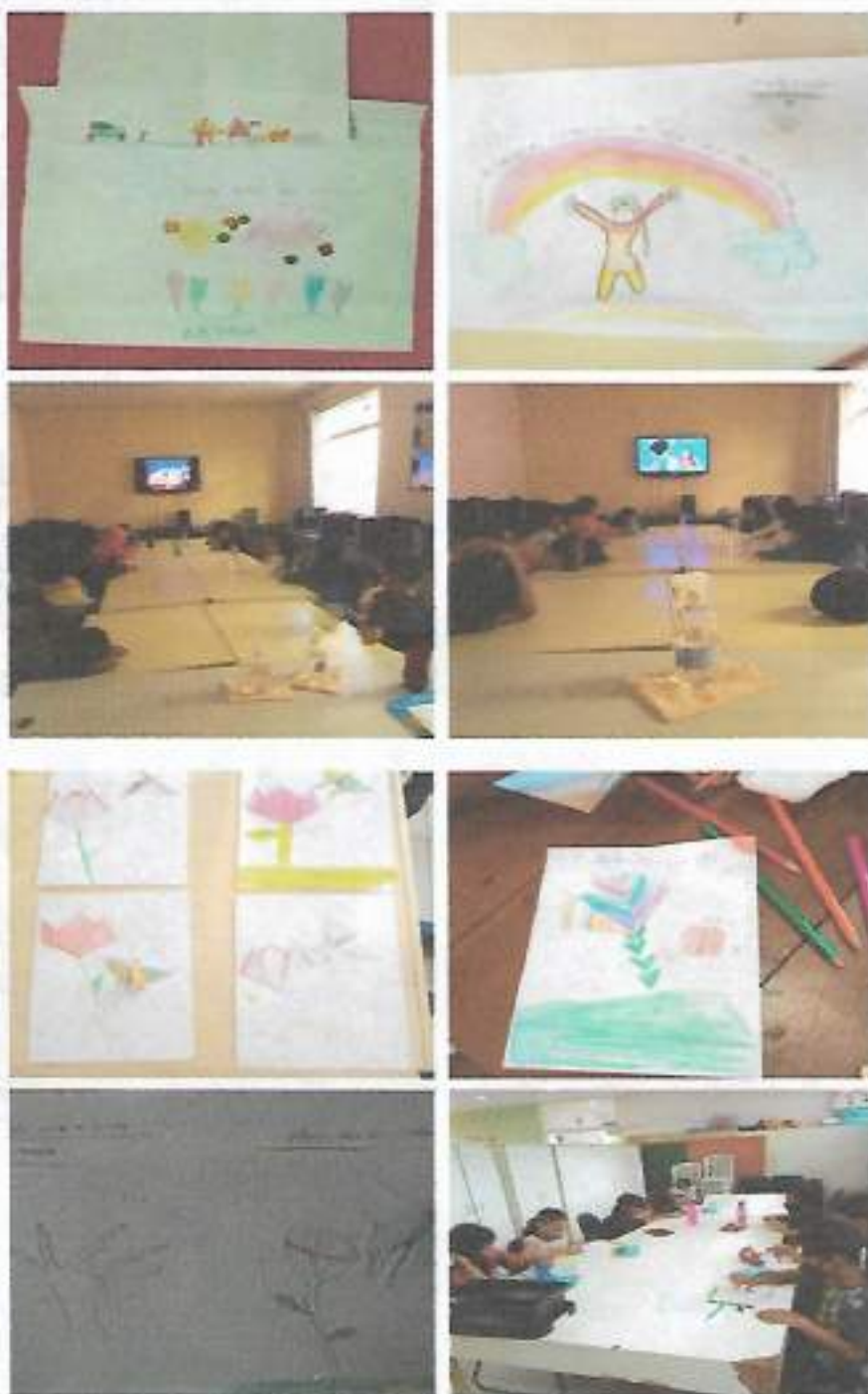
Oficina: Atividades Recreativas – Espaço Crescer