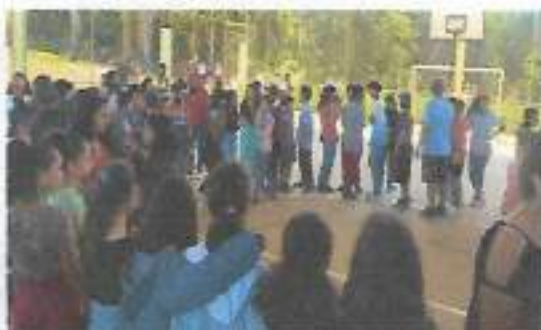
Apresentação: Oficina Rítmica - E.E. Constantino Simões de Lima