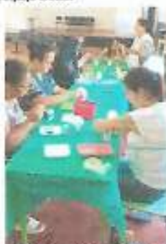
Oficina Artesanato - Boa Vista/ CRAS Tanque