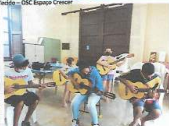
Oficina Violão – CRAS Tanque