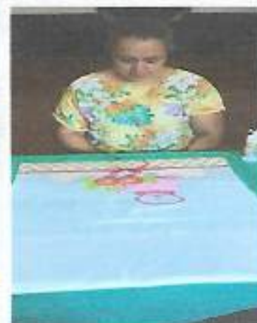
Oficina Artesanato – Bairro Boa Vista