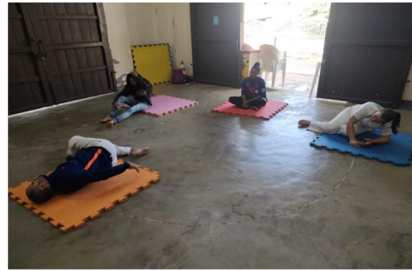
Oficina: Capoeira – CRAS Tanque