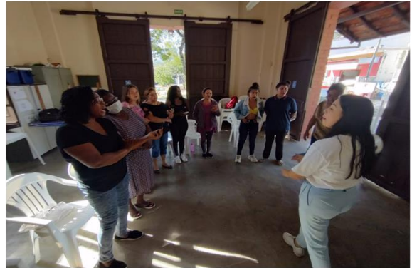
Oficina: Canto – CRAS Tanque