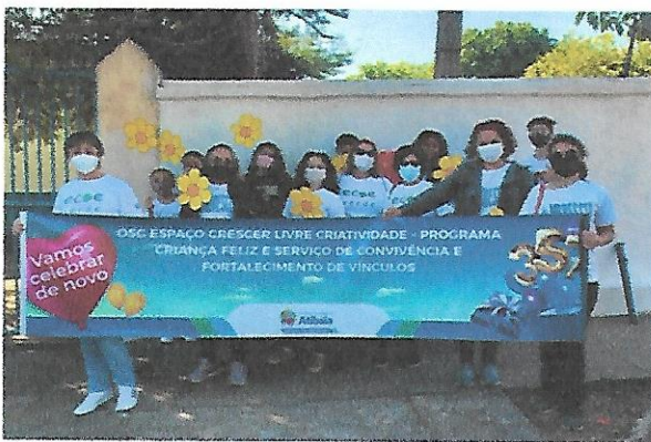
Desfile Cívico - SCFV