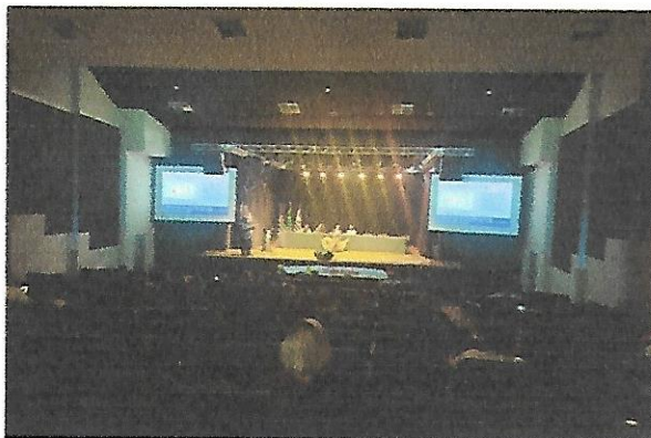
1º Fórum Regional de Combate ao Trabalho Infantil