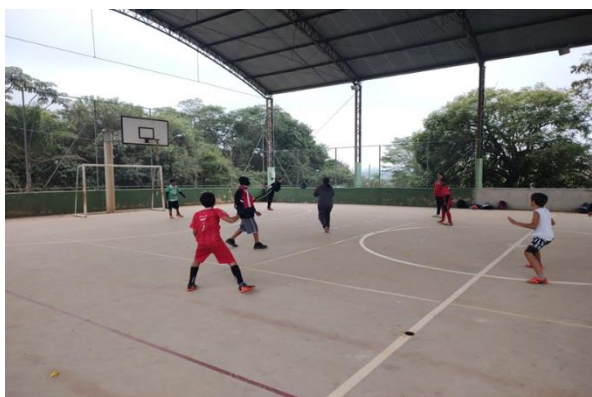
Oficina Futsal: Bairro Boa Vista