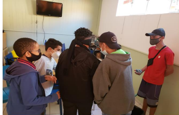
Dinâmica: Influências – OSC Espaço Crescer: Grupo Violão