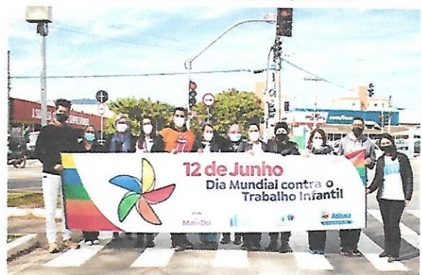
Ação "12 de Junho" - Junto à Secretaria de Assistência e Desenvolvimento Social