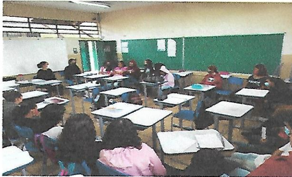
Roda de Conversa: Bullying: E.E. Maria do Carmo Barbosa