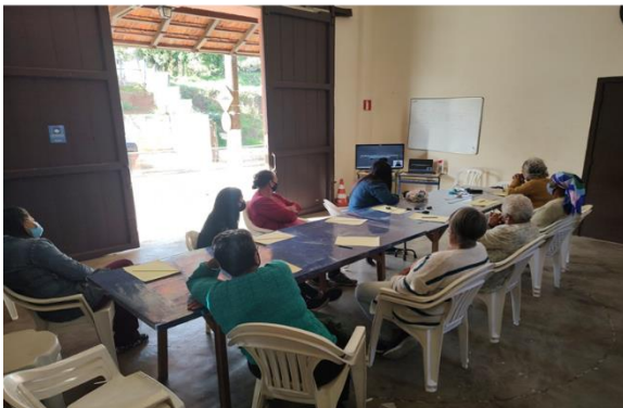
Oficina: Artesanato CRAS Tanque