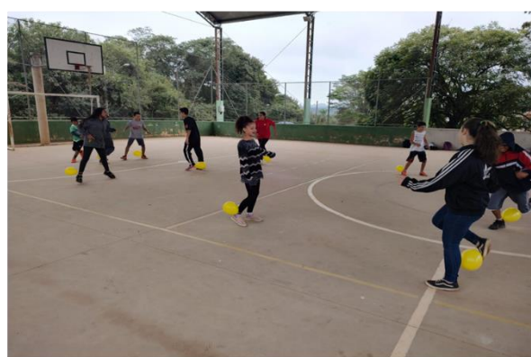
Dinâmica: Protegendo o meu balão – Bairro Boa Vista