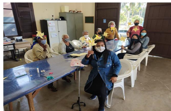
Confecção Catavento - CRAS Tanque