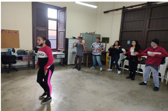
Oficina: Ritmos – CRAS Tanque