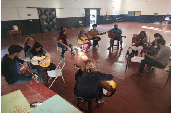
Oficina Violão: Bairro Boa Vista