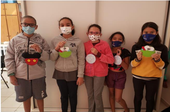
Oficina: Artes em Tecido – OSC Espaço Crescer