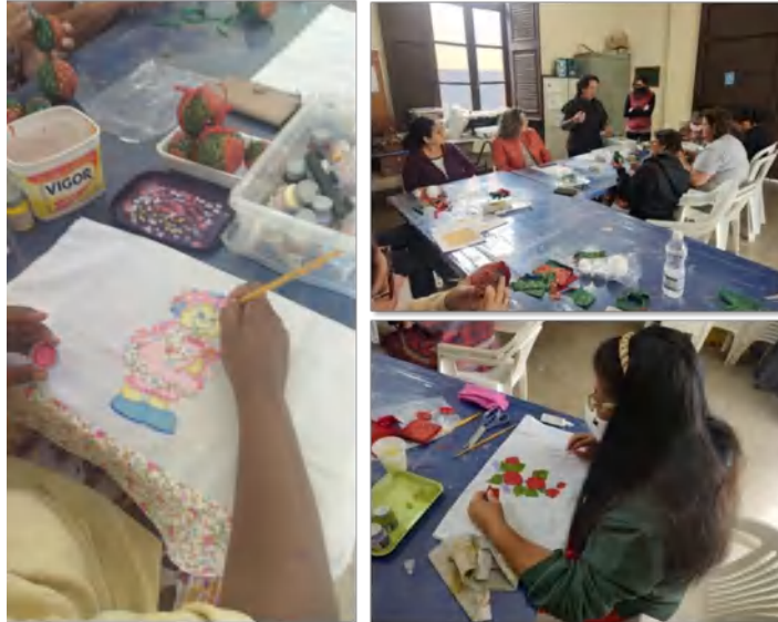
Grupo: Artesanato – Cras Tanque