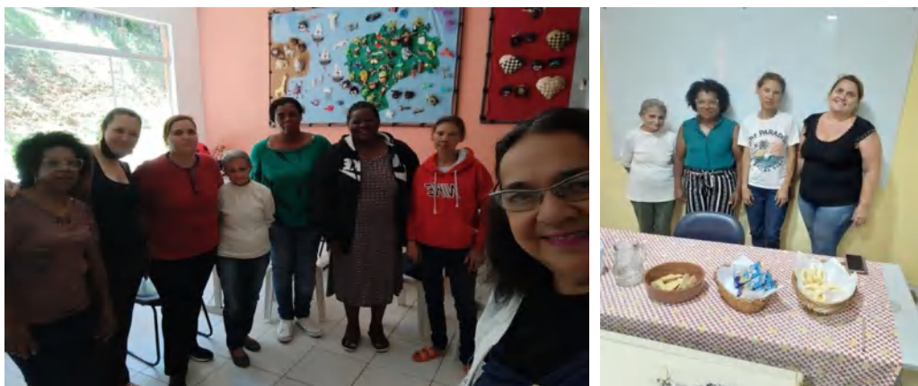
Grupo de Mulheres – Roda de Conversas – Osc Espaço Crescer