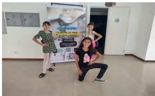
Apresentação Grupo: Ballet – Escola Premiere Studio de Dança – Cine Itá Cultural