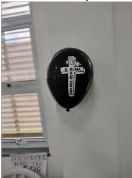
VI Conferência Municipal dos Direitos da Criança e do Adolescente – Sest Senat