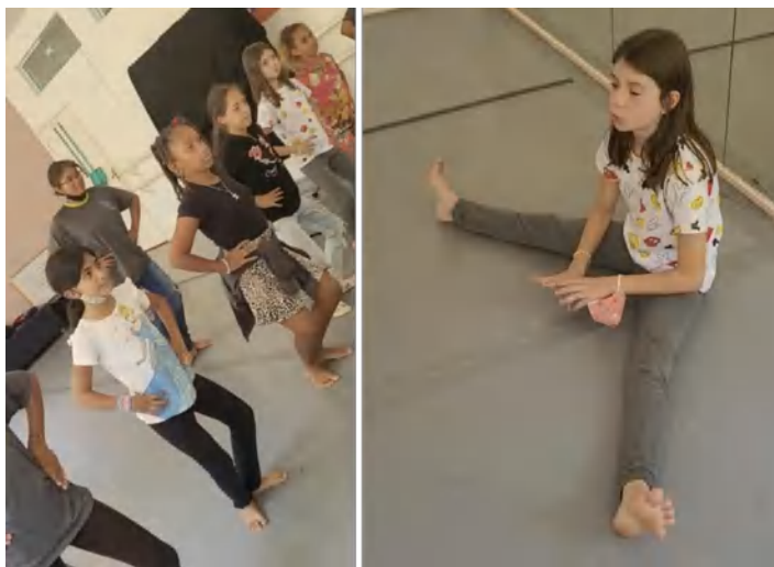
Grupo: Ballet – Osc Espaço Crescer