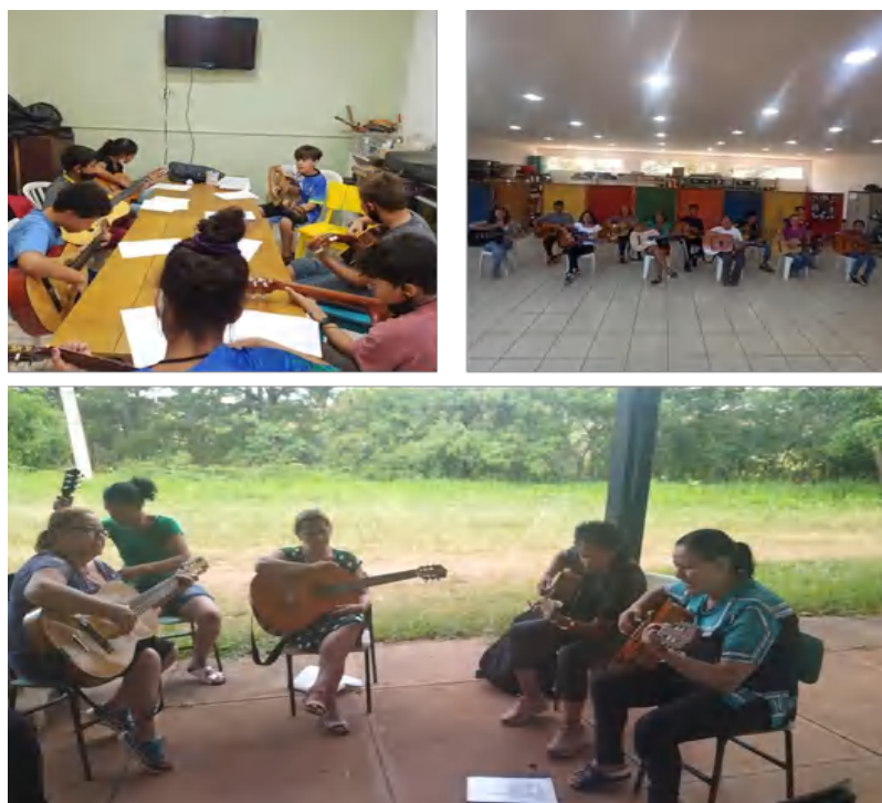
Grupo: Violão –C. Comunitário B.V./Cras Tanque e Osc – Ensaio Geral Osc Espaço Crescer