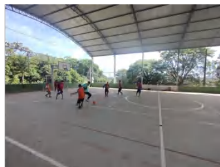
Grupo: Futsal – Quadra E.E. Constantino - Boa Vista