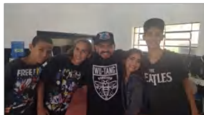
Grupo: Hip Hop – C. Comunitário Boa Vista – Ensaio Geral Osc Espaço Crescer