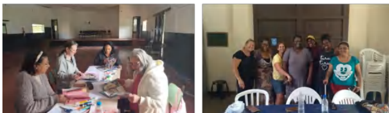
Grupo: Canto – Cras Tanque e C. Comunitário Boa vista – Intervenção: “Manchetes da Vida”