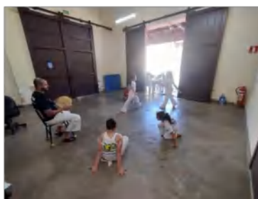
Grupo: Capoeira – Cras Tanque e Osc Espaço Crescer – Intervenção: “Projetos de Vida”