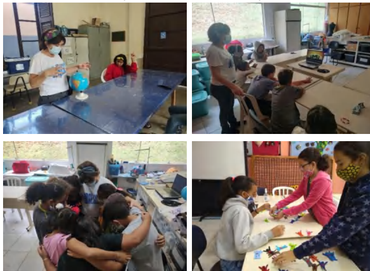
Grupo: Artes em Tecido –Cras Tanque e Osc – Intervenção “Consciência Negra”