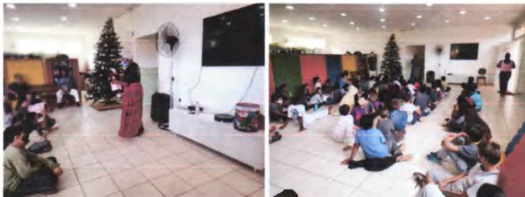
Intervenção – Consciência Negra – Osc Espaço Crescer