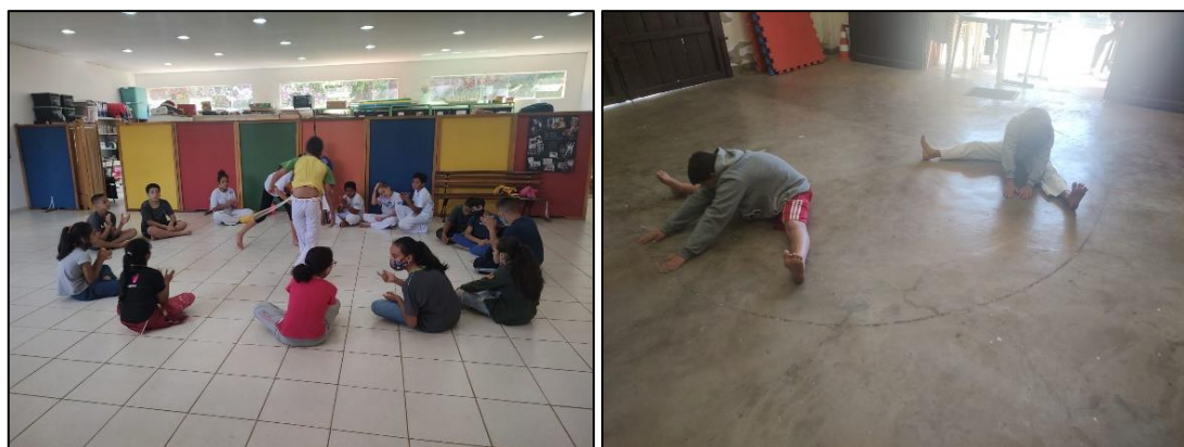
Grupo: Capoeira – Osc e Cras Tanque