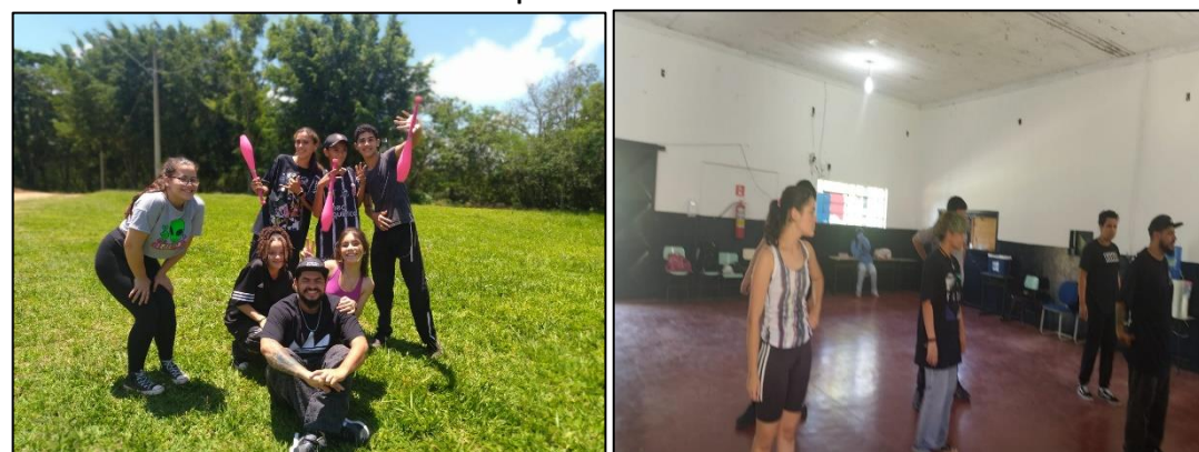
Grupo: Hip Hop – Boa Vista