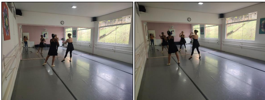
Grupo: Ballet – Osc Espaço Crescer