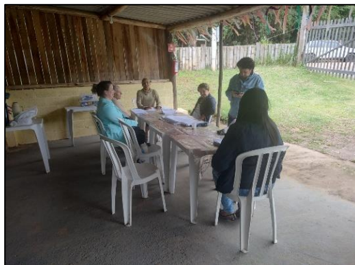
Grupo: Artesanato – Cras Tanque e Cachoeira