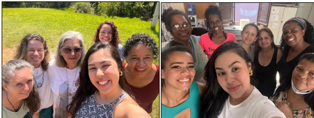
Grupo: Canto – Boa Vista e Cras Tanque