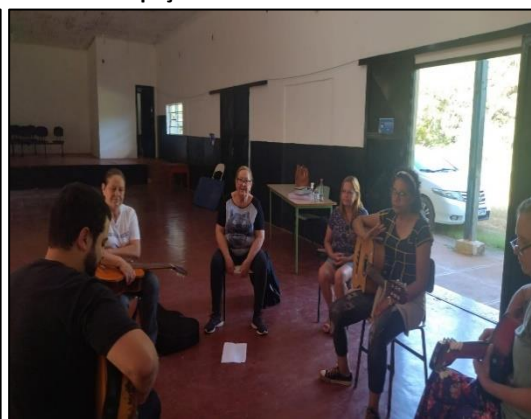
Grupo: Violão – Cras Tanque e Boa Vista