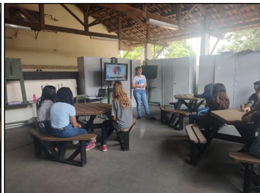
Pré-Conferência dos Direitos da Criança e do Adolescente – Escola Estadual Maria do Carmo – Tanque