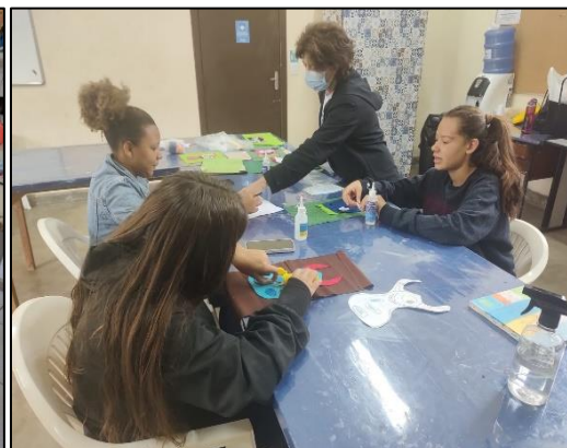
Grupo: Artes em Tecido – Osc e Cras Tanque