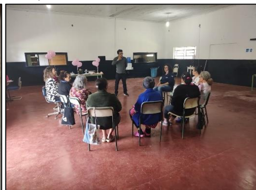
Roda de Conversas – Tema: “Outubro Rosa” – Tanque e Boa vista