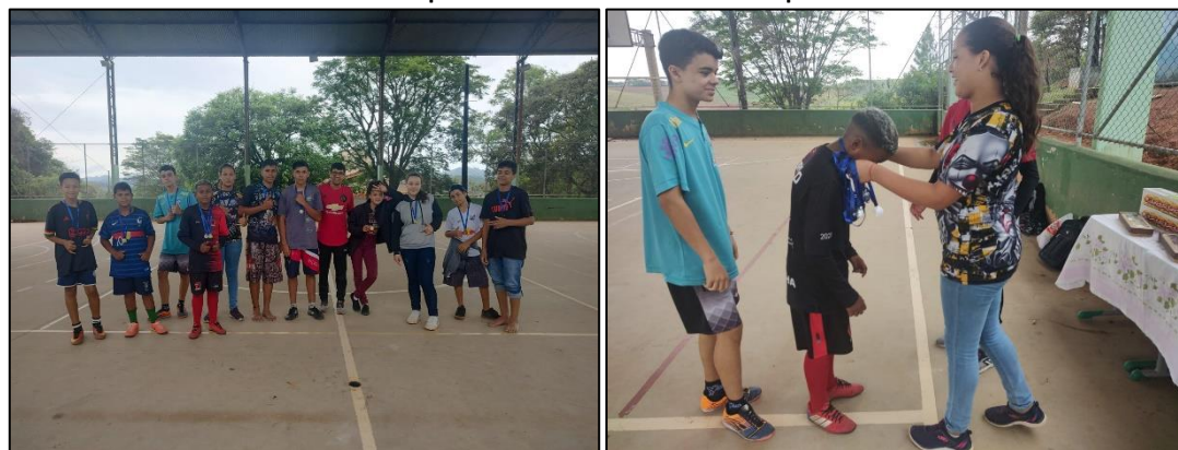
Grupo: Futsal – Boa Vista