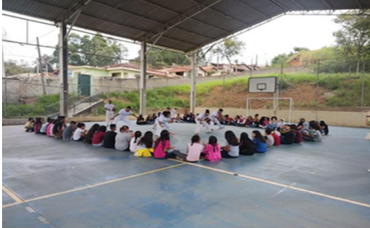
Apresentação Oficina de Capoeira E.E. Maria do Carmo