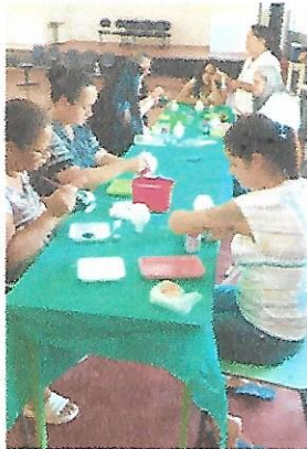
Oficina Artesanato - Boa Vista/ CRAS Tanque