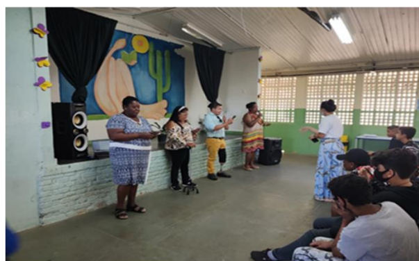
Apresentação Oficina de Canto E.E. Maria do Carmo