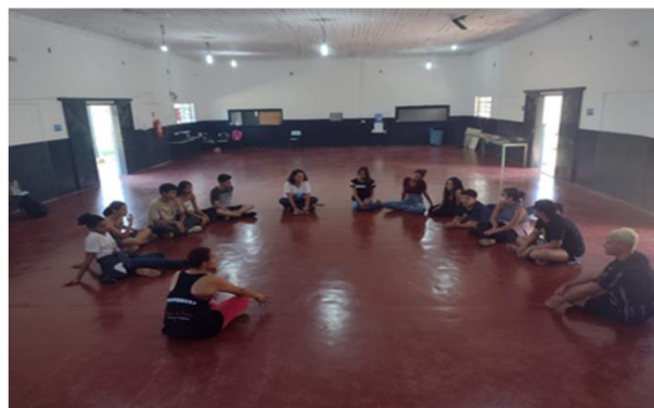
Oficina Ritmos – Roda de Conversa - Boa Vista