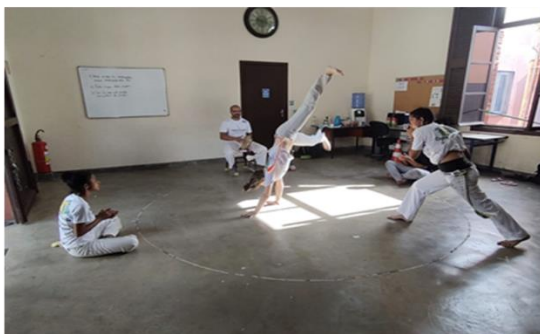
Oficina de Capoeira – CRAS Tanque