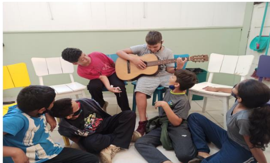
Oficina Violão – OSC Espaço Crescer