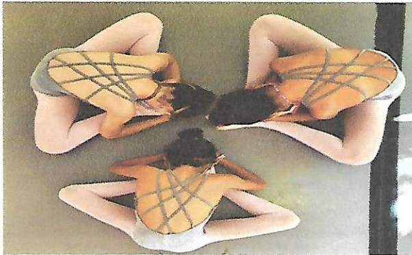
Oficina Dança – OSC Espaço Crescer