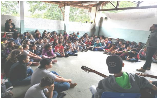
Apresentação Oficina de Violão E.E. Maria do Carmo