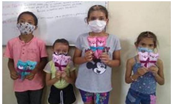
Oficina de Artes em Tecido – CRAS Tanque