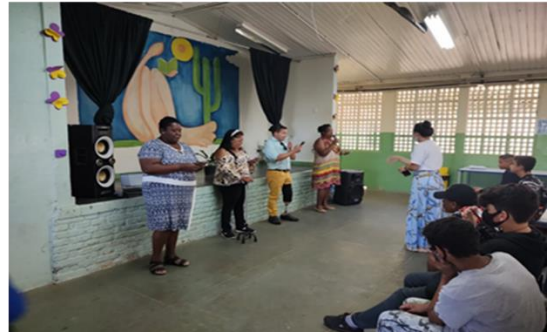
Apresentação Oficina de Canto E.E. Maria do Carmo