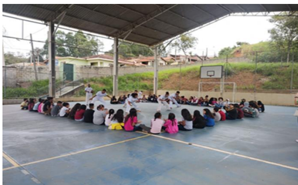
Apresentação Oficina de Capoeira E.E. Maria do Carmo