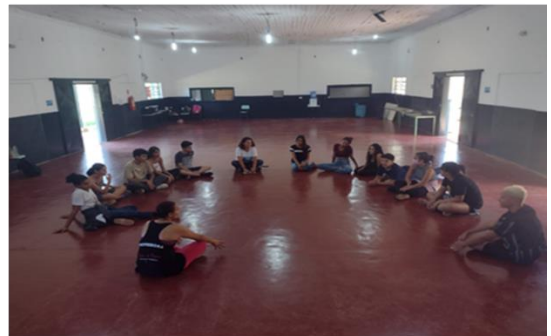
Oficina Ritmos – Roda de Conversa - Boa Vista