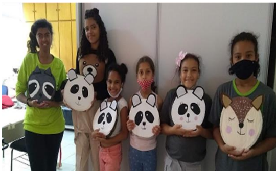
Oficina de Artes em Tecido – OSC Espaço Crescer