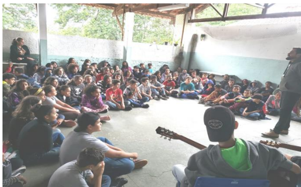
Apresentação Oficina de Violão E.E. Maria do Carmo