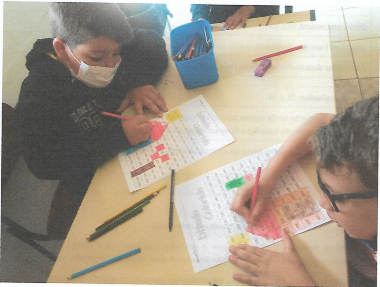
Alunos atendidos: 61

Objetivo da atividade: Aprofundar os conhecimentos matemáticos através da resolução de problemas, incluindo problematizações de jogos, uso de materiais concretos, novas tecnologias e projetos. Desenvolver no aluno a capacidade de resolver problemas, estimulando para tanto, a curiosidade e o espírito investigativo através de atividades lúdicas e desafiadoras.