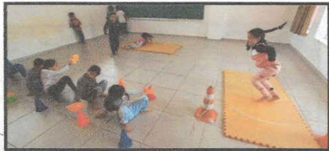
trabalho em equipe.