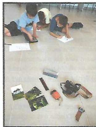
Anos atendidos: 2º, 3º, 4º e 5º ano