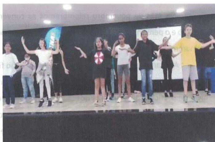
Apresentação de Hip Hop na VI Conferência dos Direitos da Criança e do Adolescente 25/11/2022