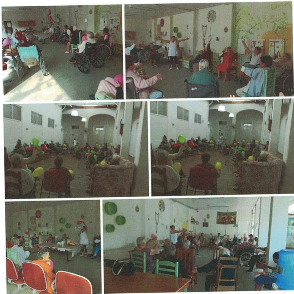
Oficina da Memória "Recordar e viver"