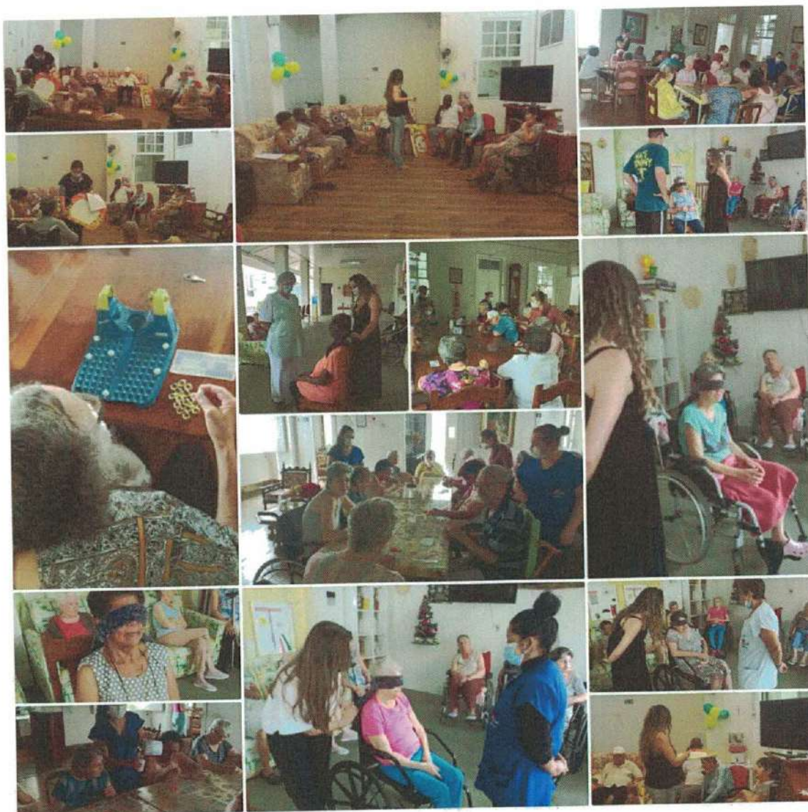
Oficina "Cinema em casa"