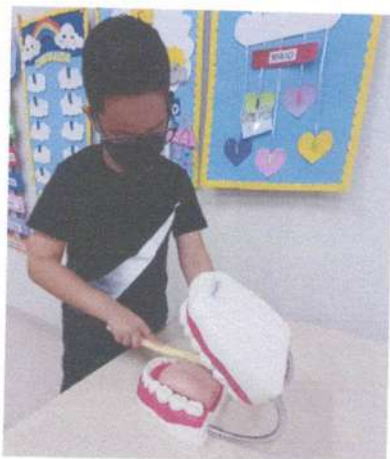
ATIVIDADE: ARCADA DENTÁRIA: SIMULAÇÃO DA ESCOVAÇÃO BUCAL