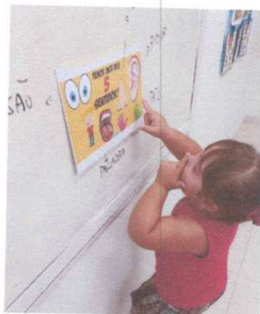
ATIVIDADE: EXPLORANDO OS CINCO SENTIDOS