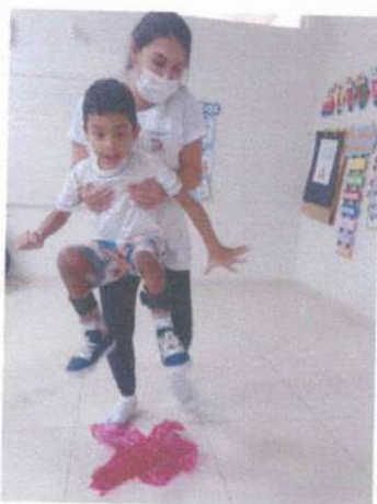
ATIVIDADE: TRABALHANDO MOVIMENTO: PULAR A FOGUEIRA