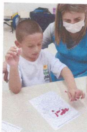
ATIVIDADE: FOLCLORE: COLAGEM COM PEDAÇOS DE EVA