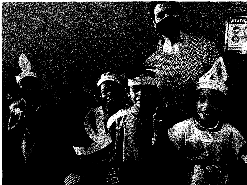
Figura: confecção de máscaras e cenouras pelo 1ºano.