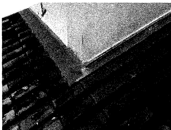
Reformas no telhado; Pinturas de salas de aulas e materiais pedagógicos

Finalização da compra de materiais pedagógicos e bens como impressora, plastificadora, mouse, teclado, fones de ouvidos e caixinhas de som para a Sala de Recursos Multifuncionais.